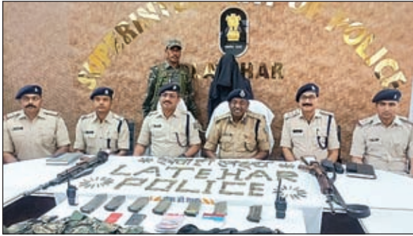
बरामद हथियार व गिरफ्तार माओवादी की जानकारी देते डीआईजी।

लेवी वसूली करना है। इसके अलावे ये अपने दस्ता सदस्य के साथ मिलकर सुरक्षा बलों को नुकसान पहुंचाने के लिए कई बार आइडडी ब्लास्ट करवाकर एवं एम्बुस कर सुरक्षा बल को अपना निशाना बनाये जिसमें हमारे कई सुरक्षाबल शहीद हुए तथा निर्दोष ग्रामीण एवं महिलाये, घायल हुये और मारे गये। इसके साथ ही उन्होंने बताया कि गिरफ्तार अभियुक्त के विरुद्ध लातेहार, लोहरदगा, गुमला जिला के विभिन्न थानों में 68 काण्ड पूर्व से दर्ज है।