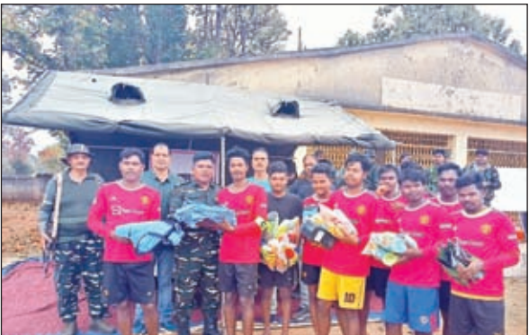
सामग्री देते सीआरपीएफ अधिकारी।