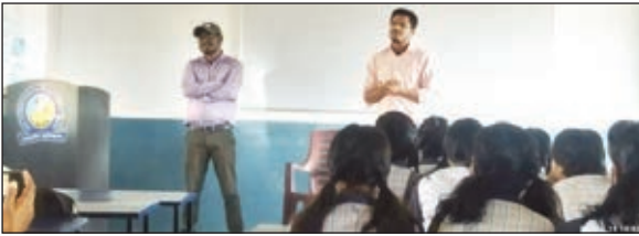
जानकारी देते विशेषज्ञ