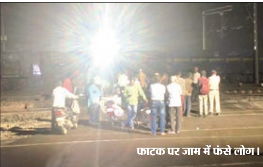
फाटक पर जाम में फंसे लोग।