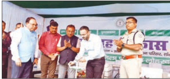
उद्घाटन करते अतिथि व उपस्थित लोग