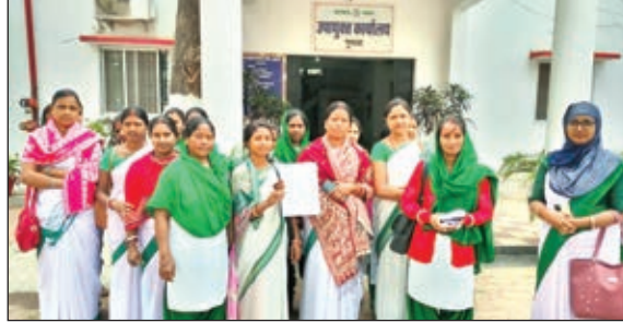
डीसी को ज्ञापन सौंपने पहुंची सहियाएं

गुमला। कोविड-19 महामारी के दौरान मोबिलाइजेशन वैकसीनेशन में अहम योगदान करने वाले सहियाओं ने उपायुक्त को ज्ञापन सौंपकर जल्द से जल्द प्रोत्साहन राशि के भूगतान की मांग की है। सहियाओं ने कहा कि अपनी जान जोखिम में डालकर कोविड से ग्रस्त मरीजों के बीच जाकर