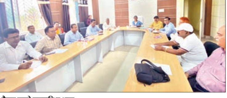
बैठक करते कुलपति व अन्य

मेडल प्रदान करेंगे। केंद्रीय मंत्री अर्जुन मुंडा इस कार्यक्रम के मुख्य अतिथि होंगे। बैठक में दीक्षांत समारोह में मैडल प्राप्त करने वाले छात्र-छात्राओं के लिए ड्रेस निर्धारित किया गया है। छात्रों को सफेदकुर्ता, पेजामा, छात्राओं के लिए सफेद सलवार सूट और