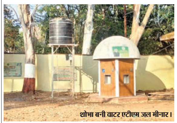
शोभा बनी वाटर एटीएम जल मीनार।

लातेहार जिले में इन जगहों पर लगाए गए हैं वाटर एटीएम