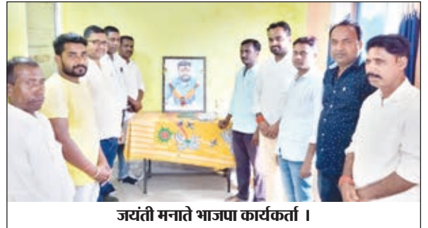
जयंती मनाते भाजपा कार्यकर्ता।