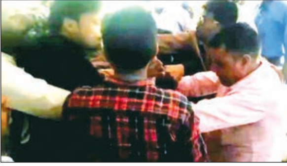
बैठक के दौरान कंपनी के लोग व मैन पावर कर्मचारी।