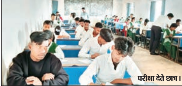
परीक्षा देते छात्र।

बारियातू। झारखंड अधिविध परिषद द्वारा आयोजित इंटर की परीक्षा के लिए प्रखंड में बनाए गए दो परीक्षा केंद्र आदर्श मध्य विद्यालय बारियातू व राजकीय कृत मध्य विद्यालय साल्वे में बुधवार को द्वितीय पाली में अनुशासनबद्ध शांतिपूर्ण तरीके से संपन्न हुई। आदर्श मध्य विद्यालय बारियातू में इंटर इंग्लिश ए की परीक्षा में 182 परीक्षार्थी में एक अनुपस्थित उपस्थित रहे। जबकि हिन्दी ए में 112 में 109 उपस्थित रहे तीन अनुपस्थित रहे। इधर राजकीय कृत मध्य विद्यालय