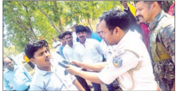
अभियान के दौरान जांच करते अधिकारी।