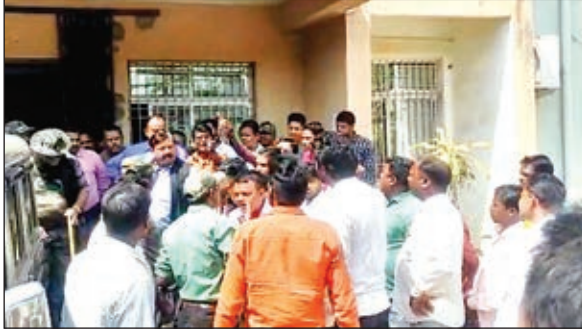
झड़प के बाद मौजूद भीड़।

चंदवा। चंदवा के अभिजीत प्लांट में बुधवार को मैन पावर संघ की नई कमिटी के लोग व स्क्रेप उठाव कर रही कंपनी मितल आयरन स्टील लिमिटेड के प्रतिनिधि पीएसीएल चंडीगढ़ के एमपीएस राणा के लोग, उनके सफेदपोश समर्थकों के बीच तीखी नॉक-झोंक व झड़प हो गयी। घटना का वीडियो सोशल मीडिया पर जमकर वायरल हो रहा है। घटना के संबंध में मैन