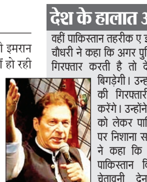
देश के हालात और बिगड़ते

रांची। पाकिस्तान के पूर्व प्रधानमंत्री इमरान खान की मुसीबतें कहीं से भी कम नहीं हो रही हैं। तोशाखाना मामले में पुलिस उनके घर उन्हें गिरफ्तार करने पहुंची, लेकिन इमरान अपने कमरे में नहीं मिले। पुलिस ने घर में काफी खोजबीन की पर इमरान कहा है इसकी सुराग पुलिस को नहीं मिली, यानी गिरफ्तारी से पहले ही इमरान फरार हो गये हैं। वे अपने घर से गायब मिले। वहीं, उनके घर के बाहर पीटीआई समर्थक भारी संख्या में मौजूद हैं। पुलिस के साथ उनकी जम कर झड़प भी हुई। समर्थकों का कहना है कि किसी कीमत पर अपने नेता को वे गिरफ्तार नहीं होने देंगे। (शेष पेज 11 पर)