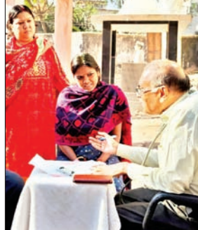
जांच करते डॉक्टर।