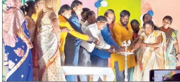
समारोह का शुभारंभ करते मिशन बदलाव के संस्थापक सदस्य।

गुमला। मिशन बदलाव का स्थापना दिवस सह सम्मान समारोह नगर भवन गुमला में संपन्न हुआ। समारोह में जनहित में कार्य करने वाले कार्यकर्ताओं को सम्मानित किया गया। मिशन बदलाव के युवाओं के द्वारा कार्यक्रम की शुरुआत जनजागृति अभियान से शुरू किया गया और जुलूस के माध्यम से युवाओं को नशापान से दूर रहने एवं भ्रष्टाचार मुक्त समाज बनाने की अपील की गई। जुलूस के बाद शहीद टावर चौक स्थित शहीद स्मारक, अल्बर्ट एक्का चौक और बाबा साहब भीमराव अंबेडकर की प्रतिमा पर माल्यार्पण किया गया। नगर भवन में मिशन बदलाव के सदस्यों के लिए द्वारा संस्कृतिक कार्यक्रमों का भी आयोजन किया गया। स्थापना दिवस समारोह को संबोधित करते हुए मिशन बदलाव