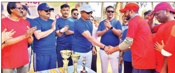
खिलाड़ियों को पुरस्कृत करते एसपी।