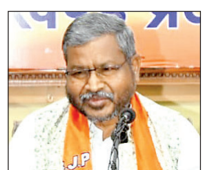
राज्यपाल को शीघ्र सौंपे जायें, सीबीआइ जांच की करेंगे मांग