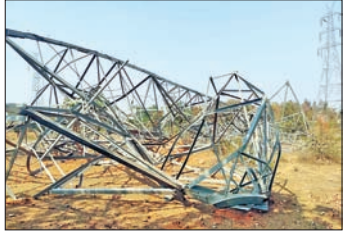
गिरा हुआ हाई टेंशन टॉवर