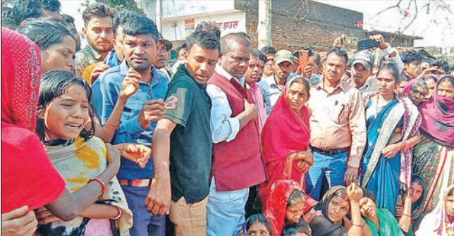
सड़क जाम हटाने के लिए लोगों को समझाते स्थानीय विधायक व अन्य