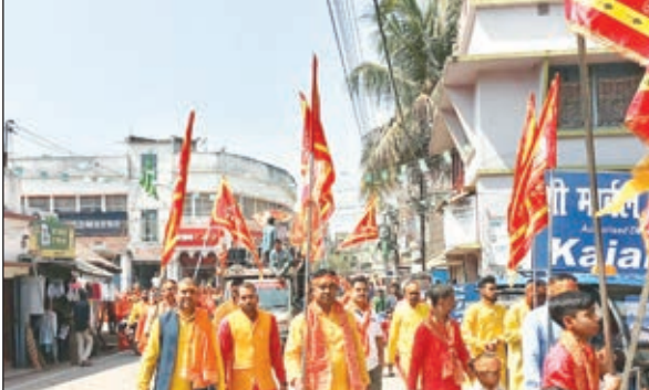
धरना प्रदर्शन करते बाल श्रमिक शिक्षक एवं शिक्षकेतर संघ के लोग।