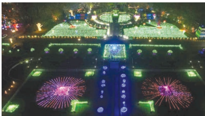
विद्युत सज्जा से जगमग हुआ टाटा का जुबिली पार्क।

जमशेदपुर। टाटा समूह के संस्थापक एवं टाटा स्टील लिमिटेड की स्थापना करने वाले जमशेद जी नंसेरवान जी टाटा की 184 वीं जयंती 3 मार्च को धूमधाम से मनायी जायेगी। इस अवसर पर टाटा स्टील और उसकी सहयोगी कंपनियों ने दुल्हन की तरह सजाया है। जयंती समारोह में भाग लेने के लिए गुरुवार 2 मार्च को टाटा ग्रुप के चेयरमैन एन चंद्रशेखरन, टाटा स्टील के वाइस चेयरमैन नोयेल रतन टाटा एवं निदेशकगण जमशेदपुर पहुंचेंगे। नोयेल टाटा शाम 5.10 बजे कीनन स्टेडियम के बगल में बने देश के पहले कोविड चारिंयर्स पार्क को जनता को समर्पित करेंगे। चेयरमैन एन चंद्रशेखरन शाम 6.10 बजे जुबिली पार्क में आकर्षक विद्युत सज्जा का उद्घाटन करेंगे। वे शाम 6.45 बजे जुबिली पार्क के रोज गार्डेन में नवस्थापित अग्न स्टील स्क्रूटर का उद्घाटन करेंगे। 3 मार्च को सुबह 8 बजे से टाटा स्टील वर्क्स में भव्य जयंती समारोह में चेयरमैन एवं वाइस चेयरमैन भाग लेंगे। सुबह 9.45 बजे चेयरमैन बिष्टुपुर पोस्टल पार्क में आम नागरिकों को संबोधित करेंगे।