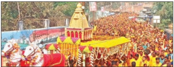
शोभायात्रा में शामिल लोग।