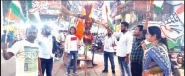
पुतला दहन करते कांग्रेसी।