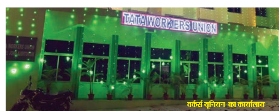
वर्कर्स यूनियन का कार्यालय