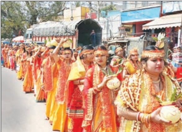
नवनिर्मित बजरंग बली मंदिर का प्राण प्रतिष्ठा को लेकर कलश यात्रा निकालती महिलाएं।