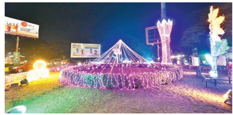
दुधिया रोशनी से नहाया जमशेदपुर का गोलचकर।