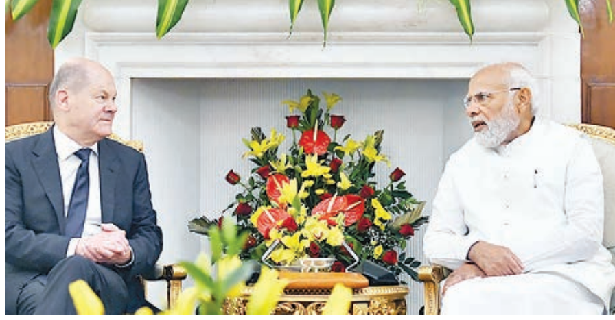
नयी दिल्ली स्थित हैदराबाद हाउस में प्रधानमंत्री नरेन्द्र मोदी से मिलते जर्मनी के चांसलर ओलोफ शोल्ट्ज।

उन्होंने कहा कि गत वर्ष जर्मनी में हमने हरित एवं सतत विकास साझेदारी की घोषणा की थी। इसके माध्यम से, हम जलवायु परिवर्तन कार्रवाई और सतत विकास लक्ष्य के क्षेत्रों में सहयोग बढ़ा रहे हैं। सुरक्षा और रक्षा सहयोग हमारी रणनीतिक साझेदारी का एक महत्वपूर्ण स्तम्भ बन सकता है। इस क्षेत्र में हमारे अनछूई क्षमताओं का पूरी तरह दोहन करने के लिए हम साथ मिलकर प्रयास