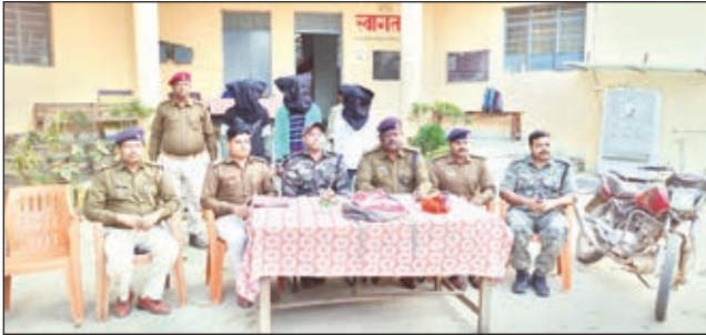
गिरफ्तार अभियुक्तों के साथ डीएसपी व अन्य ।