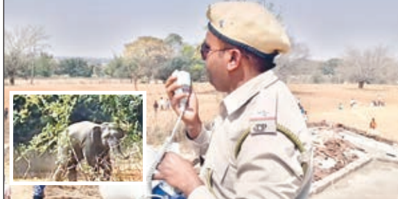
इनसेट में जंगली हाथी व लोगों को हिदायत देते कर्मी