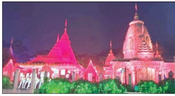
शोभा यात्रा की पूर्व संध्या पर विद्युत सज्जा से जगमगाता सूर्यधाम परिसर।