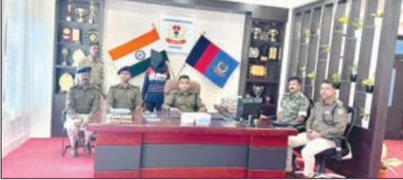
गिरफ्तार उग्रवादी के साथ एसपी व अन्य