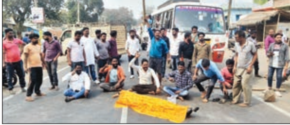
सजा दिलाने की मांग को लेकर सड़क जाम करते परिजन