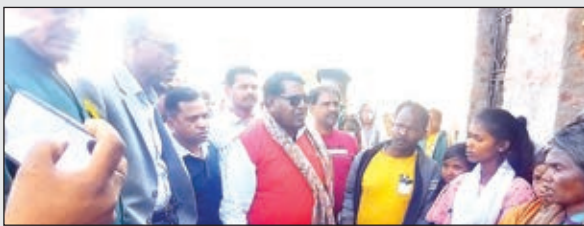
परिजनों से मिलते मंत्री

पहुंच मृतक के परिजनों एवं घायल व्यक्ति के परिजनों से मिलकर शोक व्यक्त किया, साथ ही डॉ. रामेश्वर उरांव ने कहा की यह काफी दुखद समय है और इस दुख की घड़ी में हम सब हमेशा शोकित परिवार के साथ हैं साथ ही मृतक के परिजनों को आर्थिक सहायता प्रदान 25-25 हजार रुपए तुरंत