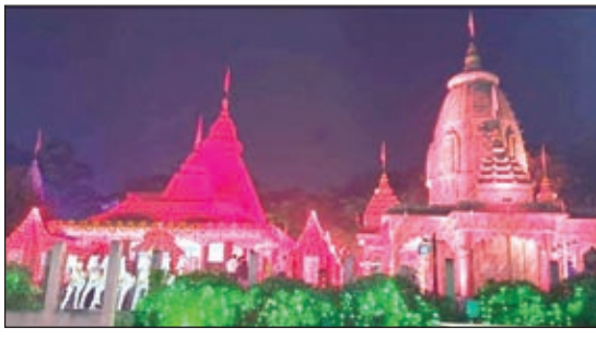
शोभा यात्रा की पूर्व संध्या पर विद्युत सज्जा से जगमगाता सूर्यधाम परिसर।