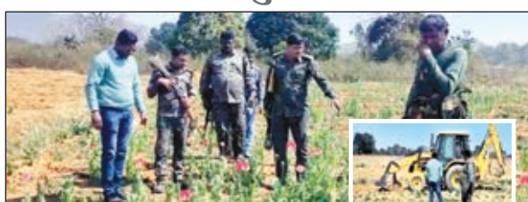
जांच करते पुलिस टीम व अफीम की फसल को करारा गया नष्ट