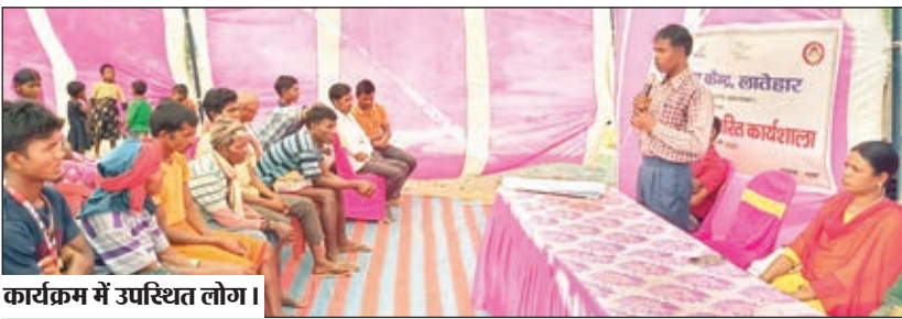
कार्यक्रम में उपस्थित लोग।

सरयू। नेहरु युवा केंद्र लातेहार के निदेशानुसार सोमवार को घासी टोला पंचायत अंतर्गत प्राथमिक विद्यालय डोरस के प्रांगण में स्थानीय विषय पर कार्यशाला कार्यक्रम का आयोजन किया गया। वहीं इस कार्यक्रम में बाल विवाह और नशा मुक्त, दहेज प्रथा व कौशल विकास के बारे में विस्तार पूर्वक लोगों को जागरूक किया गया।