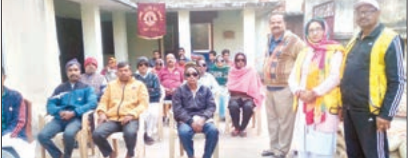
शिविर में रोगियों के साथ लायंस क्लब के पदाधिकारी