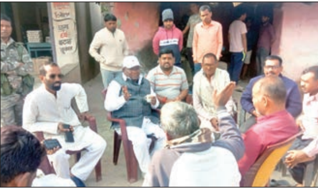
विधायक से शिष्टाचार मुलाकात करते जनप्रतिनिधि व अन्य।