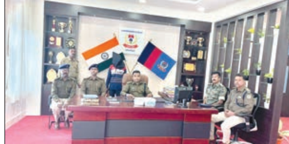
गिरफ्तार उग्रवादी के साथ एसपी व अन्य