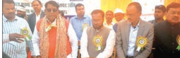
कार्यक्रम में शामिल मंत्री