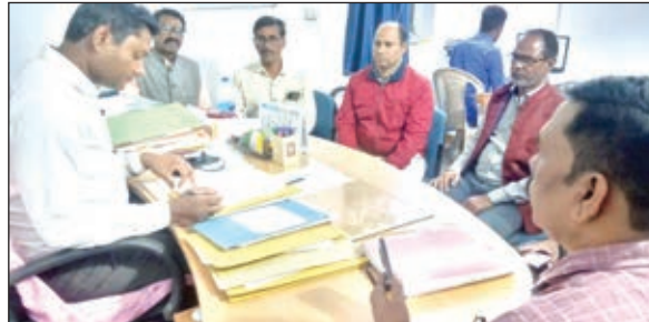
शिविर में मामलों का निष्पान करते डीएसई