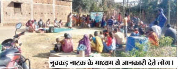
नुक्कड़ नाटक के माध्यम से जानकारी देते लोग।