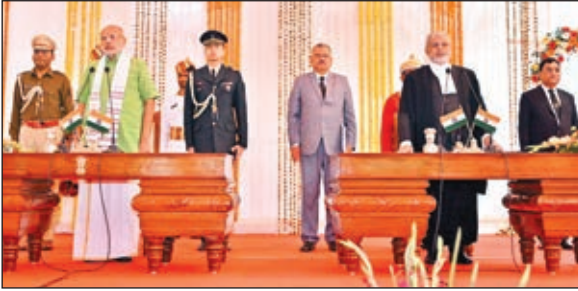
सोमवार को हाइकोर्ट के नये चीफ जस्टिस को शपथ दिलाते राज्यपाल।