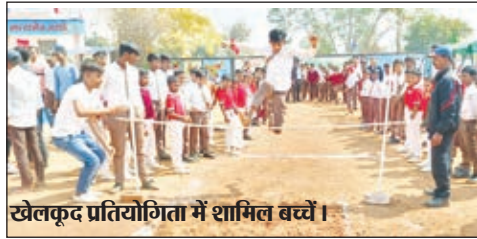
खेलकूद प्रतियोगिता में शामिल बच्चों।