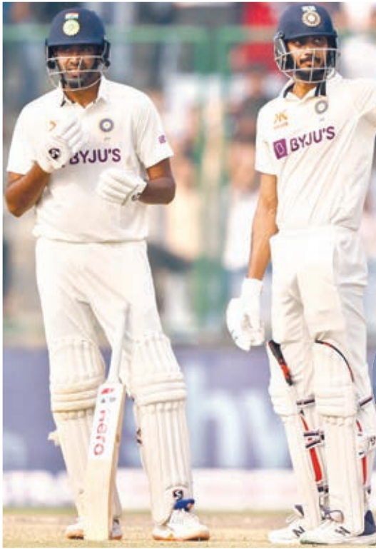
राहुल लगातार हो रहा है असफल

पिछले मैच में अर्धशतक लगाने वाले अक्षर पटेल और रविचंद्रन अश्विन ने शानदार बैटिंग करते हुए शतकीय साझेदारी की, जिससे टीम इंडिया की इज्जत बच गई। विराट कोहली (84 गेंदों में 44 रन) और रविंद्र जडेजा (74 गेंदों पर 26 रन) ने लंच के बाद के सत्र में पांचवें विकेट के लिए 59 रन जोड़कर भारतीय पारी को स्थिरता प्रदान की लेकिन टॉड मर्फी पदार्पण कर रहे बाएं हाथ के स्पिनर मैट कुहनेमैन ने दोनों को जल्दी-जल्दी आउट कर ऑस्ट्रेलिया को मजबूत स्थिति में पहुंचा दिया। इससे पहले मर्फी ने पिछले कुछ समय से भारत के लिए लगातार अच्छी बल्लेबाजी कर रहे जडेजा को पगबाधा किया। इन दोनों के पवेलियन लौटने के बाद विकेटकीपर भरत (पांच) ने बल्ले से एक और बार निराश किया। वह स्वीप शॉट खेलने के चक्रम में गेंद उनके ग्लव्स में लगी और स्पिनर में खड़े स्टीव स्मिथ ने विकेटकीपर के पीछा भाग कर शानदार कैच लपका।