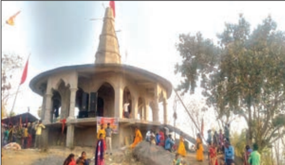
जोगिया नाथ धाम पर उपस्थित लोग