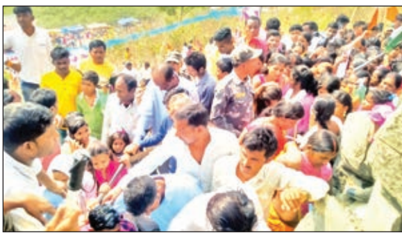
गुफा में जाने के लिए कतार में लगे लोग

भवनाथपुर। भगवान पर आस्था हो तो कठिनाइयों का सामना कर पहाड़ के गर्भ में लोग भगवान को पूजा करने से नहीं चूक रहे हैं। भवनाथपुर प्रखंड मुख्यालय से चार किलोमीटर दूरी पर सरइया गांव स्थित भवनाथपुर चूना पत्थर खदान समूह के समीप शिव पहाड़ी गुफा में श्रद्धालु डेढ़ फीट के प्रातिक गुफा में प्रवेश कर 150 फीट नीचे उतर कर पूजा करते हैं। इस होल से एक बार में एक ही व्यक्ति गुफा में प्रवेश कर