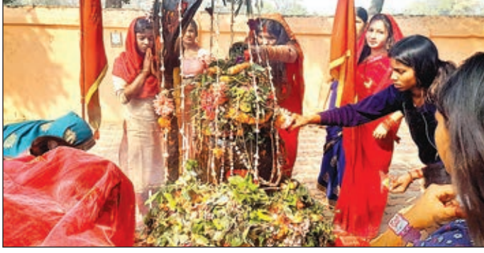
ओरमांडी में शिव लिंग का जलाभिषेक व पूजा करते भक्तगण।