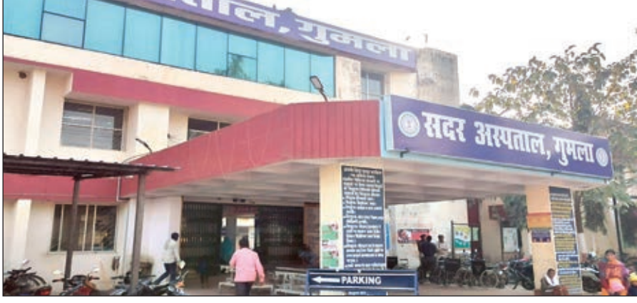
गुमला सदर अस्पताल भवन।