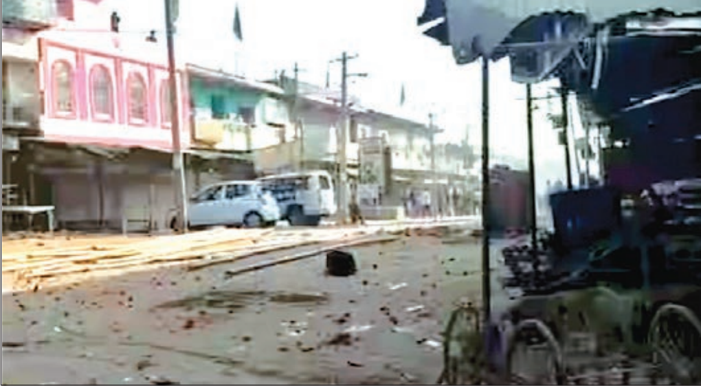
खबर मन्त्र टीम