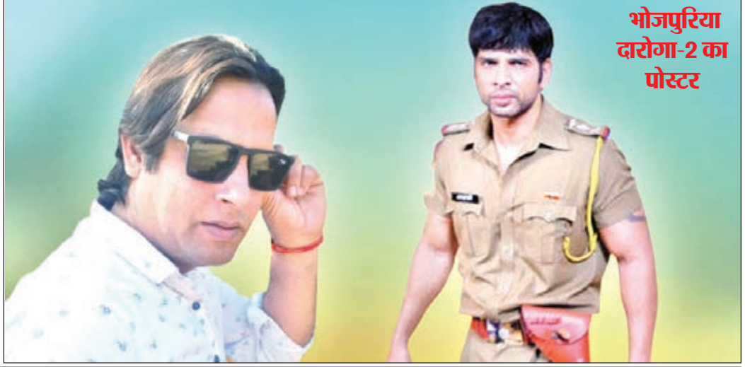
भोजपुरिया दारोगा-2 का पोस्टर