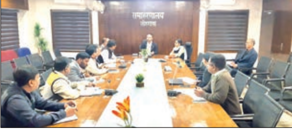
बैठक करते उपायुक्त।