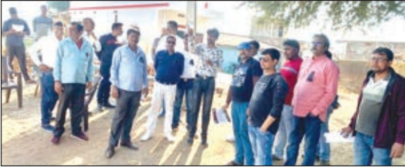
बंद को सफल बनाने निकले वैक्टर के लोग।