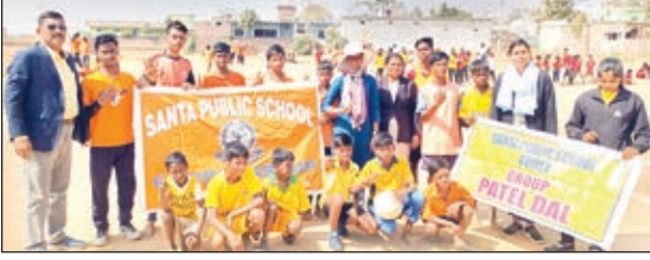
हैंडबॉल प्रतियोगिता के विजेता खिलाड़ियों के साथ स्कूल के निदेशक व शिक्षक।