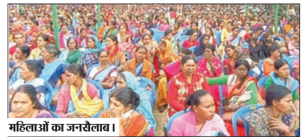
महिलाओं का जनसैलाब।