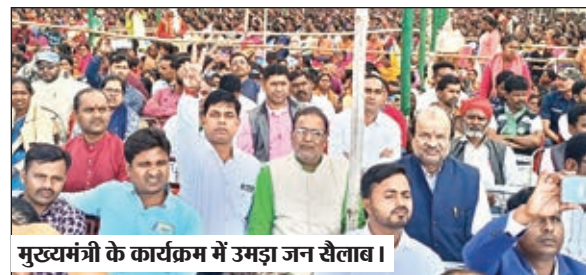
मुख्यमंत्री के कार्यक्रम में उमड़ा जन सैलाब।