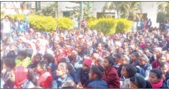
अनशन पर बैठी केजीवी गुमला की छात्राएं

गुमला। कस्तूरबा गांधी बालिका आवासीय उच्च विद्यालय गुमला की छात्राएं वार्डन को स्कूल से हटाने के विरोध में मंगलवार को स्कूल गेट पर ताला जड़कर अनशन पर बैठ गई हैं। छात्राएं वार्डन को विद्यालय में वापस बुलाने की मांग कर रही थी। छात्राओं का कहना है कि वार्डन