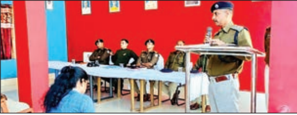
गोष्ठी में शामिल एसपी व अन्य

एसपी की अध्यक्षता में मासिक अपराध गोष्ठी का आयोजन, अछा कार्य करने वाले 14 पुलिस पदाधिकारी व कर्मी सम्मानित