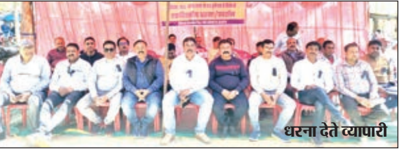
धरना देते व्यापारी