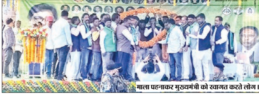
माला पहनाकर मुख्यमंत्री को स्वागत करते लोग।