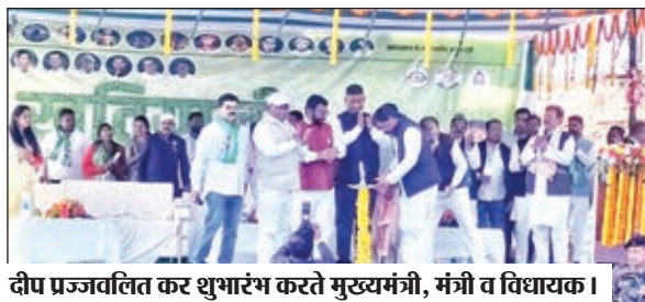
दीप प्रज्वलित कर शुभारंभ करते मुख्यमंत्री, मंत्री व विधायक।

लातेहार जिले में जमीन सर्वे के लिए नई नियमावली बनाई जायेगी। मुख्यमंत्री हेमंत सोरेन ने कहा कि लातेहार जिले में जमीन से संबंधित जो समस्याएँ उत्पन्न हुई हैं वह पुरे राज्य की समस्या है। और सभी जिलों में रजिस्टर टू फाइंडर बड़े लोगों को लाभ पहुंचाया जा रहा है जिसके लिए सरकार नई नियमावली बनाने वाली है इसके लिए प्लानिंग की जा रही है। इसके लिए इस मामले राज्य सचिव बैठक कर जल्द दिशा निर्देश जारी करेंगे।