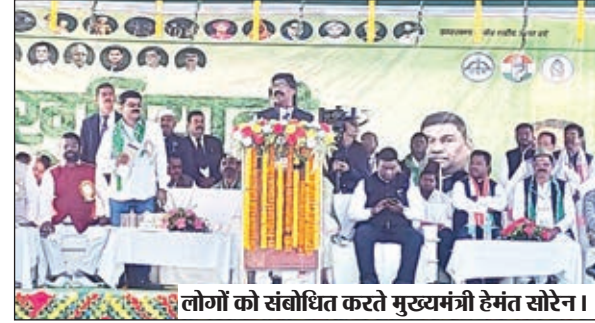
लोगों को संबोधित करते मुख्यमंत्री हेमंत सोरेन।