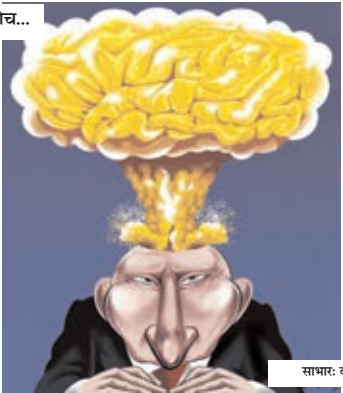
सामा: कॉटन म्यूजेंट डॉकटम