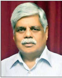
पलामू सांसद बीडी राम की फाइल फोटो।

मेदिनीनगर। पलामू सांसद बीडी राम के पहल पर जनता की चिर-परिचित मांगों पर रेल मंत्रालय ने गया-शेरघाटी, डालटनगंज वाया रफीगंज एवं