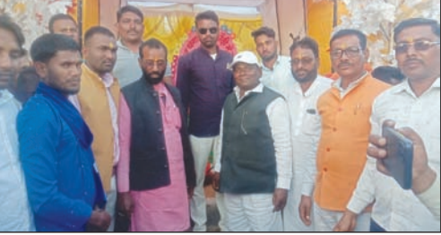
पूजा पंडालों पर उपस्थित विधायक व जनप्रतिनिधि।