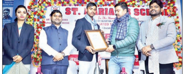
उपायुक्त को स्टेच तस्वीर भेंट करते विद्यार्थी।