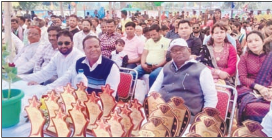
कार्यक्रम में उपस्थित विधायक व अन्य।