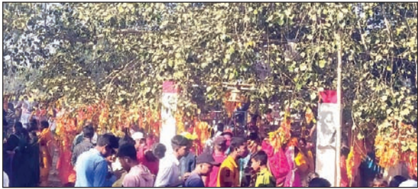
मेला में उमड़ी श्रद्धालुओं की भीड़।

गढ़वा। सदर प्रखंड के खजूरी गांव स्थित ऐतिहासिक ब्रह्मबाबा मंदिर परिसर में माघ पूर्णिमा के अवसर पर लगने वाले पांच दिवसीय मेला रविवार को संपन्न हो गया। पूर्णिमा के मौके पर मेला में श्रद्धालुओं की भीड़ उमड़ पड़ी। झारखंड सहित उत्तर प्रदेश, बिहार, छत्तीसगढ़ तथा मध्य प्रदेश से काफी संख्या में श्रद्धालुओं ने ब्रह्मस्थान पहुंचकर सत्यनारायण भगवान की कथा सुनी।