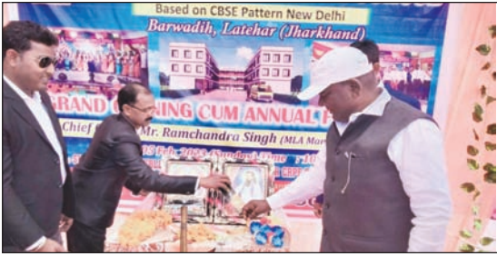
कार्यक्रम का शुभारंभ करते विधायक, संचालक व अन्य।