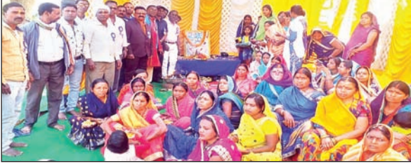
संत शिरोमणि रविदास जयंती के अवसर मौजूद लोग ।