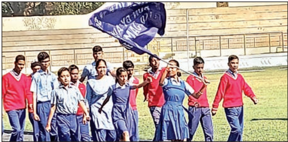
प्रतियोगिता के उद्घाटन समारोह में सार्व पास्ट करते बच्चे।