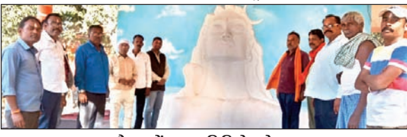
बैठक में पूजा समिति के लोग ।