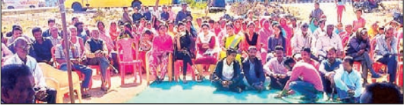
बैठक में उपस्थित लोग ।

में विकास की गंगा बहा रहे हैं। 1932 का खतियान, स्थानीय नीति, सर्वजन पेंशन योजना, 27 प्रतिशत ओबीसी आरक्षण, घर-घर जल योजना, पारा शिक्षकों को सह शिक्षक बनाना, पुराना पेंशन लागू करना, बेरोजगारों के लिए योजनाएं निकालकर लाभ पहुंचाना आदि इसके उदाहरण हैं। झारखंड सरकार ने कई योजनाएं धरातल पर उतारी हैं जिसका लाभ सभी वर्गों को मिल रहा है। बैठक के दौरान ही कई लोगों ने झामुमो व संजीव बेदिया के