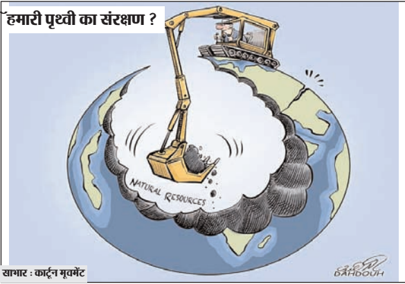
खबर : कार्टून मन्त्र