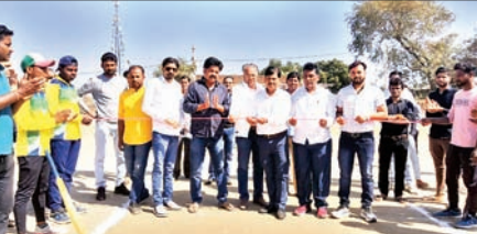
टूर्नामेंट का उद्घाटन करते अतिथि।