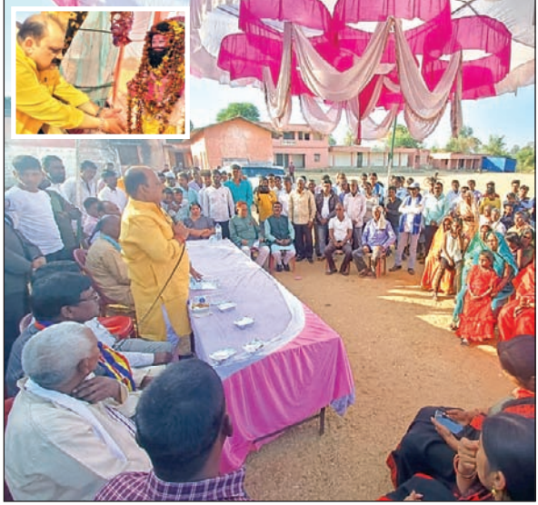
संबोधित करते व इनसेट तस्वीर पर माल्यार्पण करते मंत्री मिथिलेश ठाकुर।

गढ़वा। माघ पूर्णिमा के मौके पर जिले भर में काफी धूमधाम से संत रविदास की जयंती मनाई गई। विभिन्न स्थानों पर लोगों ने कार्यक्रम आयोजित कर संत रविदास को याद किया। गढ़वा विधायक झारखंड सरकार के पेयजल एवं स्वच्छता मंत्री मिथिलेश कुमार ठाकुर ने कई स्थानों पर आयोजित कार्यक्रम में भाग लेकर संत गुरु रविदास को नमन किया। लोगों ने उनके बताए मार्ग पर चलने का संकल्प लिया। इस दौरान मंत्री ने श्री ठाकुर ने मरहटिया में आयोजित संत रविदास क्लब, डा. भीमवार अम्बेडकर युवा क्लब झूरा, युवा जागृति क्लब पतरिया, न्यू भीम आर्मी भारत रत्न डा. भीमवार अम्बेडकर क्लब पिंपरा, मसूरिया, संत रविदास जयंती समारोह आयोजन समिति