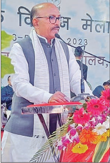
उनका रहन-सहन, खानपान भी बहुत साधारण है, फिर भी आर्थिक उन्नति नहीं हो पा रही है।

रांची। बिरसा कृषि विश्वविद्यालय में कृषि आयुक्तिकरण से आय में वृद्धि विषय के मुख्य थीम पर आयोजित तीन दिवसीय एगोटिक किसान मेला रविवार को खत्म हो गया। इसमें राज्य के विभिन्न जिलों से आये लगभग 50 हजार किसानों सहित एक लाख से अधिक लोगों ने भाग लिया। समापन समारोह में विधानसभा स्पीकर ने कहा कि झारखंड के कई क्षेत्र ऐसे हैं, जहाँ सिंचाई की सुविधा के अभाव में खेती नहीं हो पाती है। ऐसे में यहाँ मेगा लिफ्ट इरिगेशन जैसी परियोजना की जरूरत है। उन्होंने कहा कि किसानों को उत्पाद का उचित मूल्य मिले और बाजार व्यवस्था मजबूत करना भी जरूरी है। शीघ्र खराब होनेवाले कृषि उत्पादों के परिरक्षण की भी समुचित व्यवस्था होनी चाहिए। झारखंड जैसे मेहनती किसान दुनिया में बहुत कम हैं।