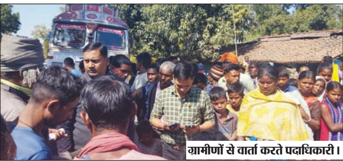
ग्रामीणों से वार्ता करते पदाधिकारी।