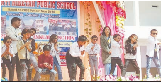
कार्यक्रम प्रस्तुत करते बच्चे।