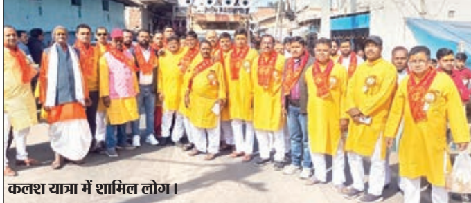
कलश यात्रा में शामिल लोग।