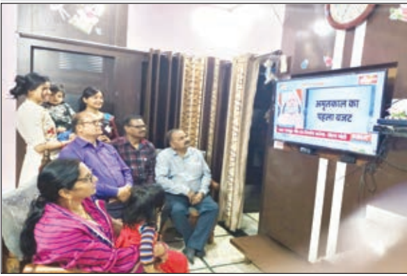
टीवी पर बजट की प्रस्तुती देखते लोग

सत्ता पत्र ने बजट को सराहा तो विपक्ष ने बजट को राजनीतिक स्टंट करार दिया