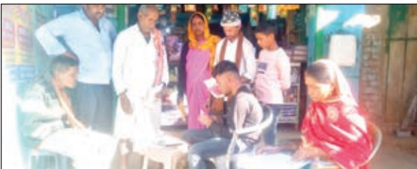
आयुष्मान कार्ड बनती सहिया।

सहिया कैंप लगाकर बना रहीं आयुष्मान कार्ड