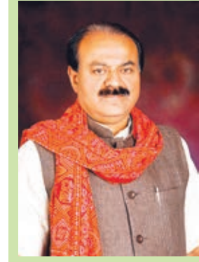
भारत को आर्थिक महाशक्ति बनाने के साथ - साथ वैश्विक मंच पर