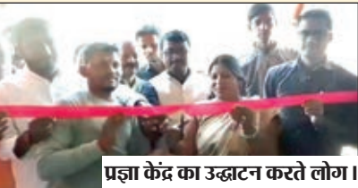
प्रज्ञा केंद्र का उद्घाटन करते लोग।

मनिका प्रखंड में प्रज्ञा केंद्र डिजिटल सेवा कॉमन सर्विस सेंटर का किया गया उद्घाटन