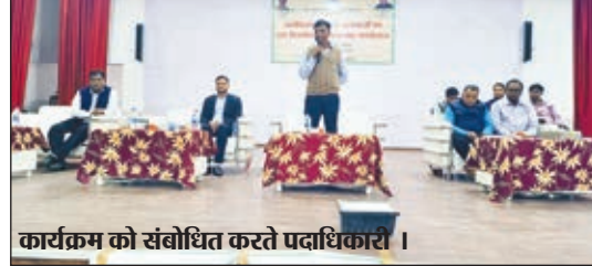
कार्यक्रम को संबोधित करते पदाधिकारी।

सामाजिक सुरक्षा के तहत सावित्रीबाई फुले किशोरी समृद्धि योजना के तहत सभी 18 वर्ष से