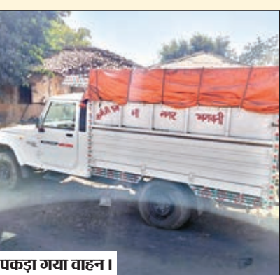
पकड़ा गया वाहन।

चंदवा पुलिस ने कोयला लोड पिकअप पकड़ा, तस्कर फरार