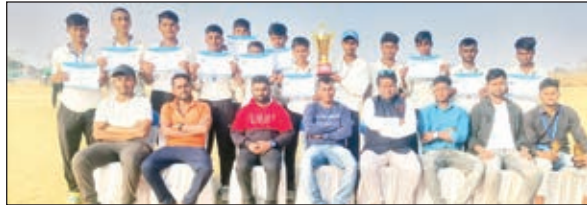
विजेता टीम के खिलाड़ी।

टाटीझरिया। आरजी क्रिकेट एकेडमी के द्वारा डहरभंगा के एंटा खेल मैदान में आयोजित क्रिकेट टूर्नामेंट का फाइनल मुकाबला आरजीसीए बनाम अप्रेडेड हाई स्कूल टाटीझरिया के बीच खेला गया। इसमें आरजीसीए की टीम 107 रनों से मैच जीतकर टूर्नामेंट का विजेता बना। आरजीसीए ने पहले बल्लेबाजी करते हुए निर्धारित 20 ओवरों में 8 विकेट खोकर 215 रन बनाए जबकि अप्रेडेड हाई स्कूल की टीम 14.5 ओवर में अपने सभी विकेटों को खोकर 108 रन ही बना सका। इस टूर्नामेंट में कुल 8 टीमों ने भाग लिया। फाइनल मैच के मुख्य अतिथि राजू यादव थे। उन्होंने कहा कि प्रतिभाओं को निखारने के लिए क्षेत्र में इस प्रकार की प्रतियोगिताओं का आयोजन लगातार होते रहना