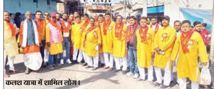
कलश यात्रा में शामिल लोग।