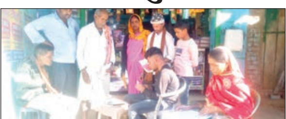
आयुष्मान कार्ड बनती सहिया।

सहिया कैंप लगाकर बना रहीं आयुष्मान कार्ड