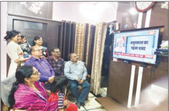
टीवी पर बजट की प्रस्तुती देखते लोग

सत्ता पत्र ने बजट को सराहा तो विपक्ष ने बजट को राजनीतिक स्टंट करार दिया