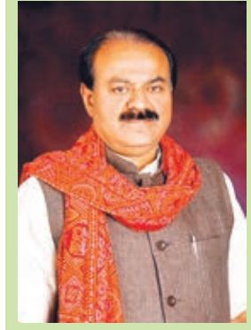
भारत को आर्थिक महाशक्ति बनाने के साथ - साथ वैश्विक मंच पर