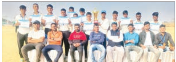
विजेता टीम के खिलाड़ी।

टाटीझरिया। आरजी क्रिकेट एकेडमी के द्वारा डहरभंगा के एंटा खेल मैदान में आयोजित क्रिकेट टूर्नामेंट का फाइनल मुकाबला आरजीसीए बनाम अप्रेडेड हाई स्कूल टाटीझरिया के बीच खेला गया। इसमें आरजीसीए की टीम 107 रनों से मैच जीतकर टूर्नामेंट का विजेता बना। आरजीसीए ने पहले बल्लेबाजी करते हुए निर्धारित 20 ओवरों में 8 विकेट खोकर 215 रन बनाए जबकि अप्रेडेड हाई स्कूल की टीम 14.5 ओवर में अपने सभी विकेटों को खोकर 108 रन ही बना सका। इस टूर्नामेंट में कुल 8 टीमों ने भाग लिया। फाइनल मैच के मुख्य अतिथि राजू यादव थे। उन्होंने कहा कि प्रतिभाओं को निखारने के लिए क्षेत्र में इस प्रकार की प्रतियोगिताओं का आयोजन लगातार होते रहना