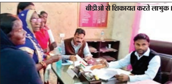
बीडीओ से शिकायत करते लाभुक।

कोडरमा। उपायुक्त आदित्य रंजन की पहल से बुधवार को सदर अस्पताल में कार्डियोलॉजी ओपीडी की शुरूआत की गई है। वहीं डॉ. मृगाल कुंज, डीएम कार्डियोलॉजिस्ट ने बताया कि वे हर महीने के प्रथम बुधवार व महीने के अंतिम बुधवार को सदर अस्पताल में मरीजों का उपचार करेंगे। इसी दौरान बुधवार को उन्होंने 21 मरीज का उपचार किया। जिसमें कई मरीजों को चलने में परेशानी, दिल की धड़कन तेज गति से बढ़ना, सीने में दर्द जैसी समस्याएं थी। उन्होंने बताया की अगर किसी मरीज का एजिओग्राफी या पेंस मेकर की ऑपरेशन की आवश्यकता पड़ती है तो आयुष्मान भारत मुख्यमंत्री जन आरोग्य योजना के तहत उनका इलाज निःशुल्क किया जायेगा।