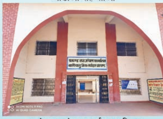
प्रखंड सह अंचल कार्यालय बारियातू