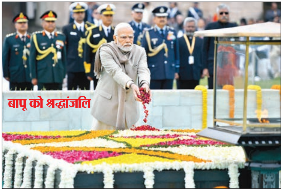
बापू को श्रद्धांजलि

राष्ट्रपिता महात्मा गांधी की सोमवार को 75वीं पुण्यतिथि थी। इस मौके पर प्रधानमंत्री नरेंद्र मोदी गांधी स्मृति में आयोजित प्रार्थना सभा में शामिल हुए। राष्ट्रपति द्रौपदी मुर्मू भी पुण्यतिथि पर श्रद्धांजलि देने राजघाट पहुंची।