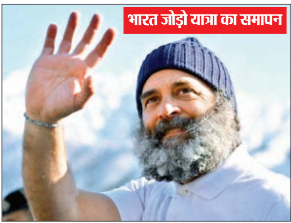
भारत जोड़ो यात्रा का समापन

श्रीनगर। भारी बर्फबारी के बीच राहुल गांधी की भारत जोड़ो यात्रा सोमवार को श्रीनगर में खत्म हो गई। राहुल ने क्लोजिंग सेरेमनी के दौरान शेर-ए-कश्मीर स्टेडियम में 35 मिनट लंबी स्पीच दी। कांग्रेस की भारत जोड़ो यात्रा का सोमवार को समापन हो गया। इस दौरान राहुल गांधी ने श्रीनगर के शेर-ए-कश्मीर स्टेडियम में जनसभा को संबोधित किया। वो इंदिरा, राजीव गांधी को याद करते हुए भावुक हो गए। राहुल गांधी ने खुलासा किया कि कांग्रेस यात्रा के दौरान उन्होंने टी-शर्ट क्यों पहनी थी। संबोधन के दौरान राहुल ने चार बच्चों की कहानी सुनाई, जिनसे वे भारत जोड़ो यात्रा के दौरान मिले थे, और कहा कि वे भिखारी थे, जिन्होंने स्वेटर नहीं पहने थे और सर्दियों में कांप रहे थे, जिसने उन्हें यात्रा के दौरान जैकेट नहीं पहनने के लिए प्रेरित किया। राहुल ने कहा मैंने उन्हें गले से लगा लिया। वे ठंडे और कांप रहे थे। शाब्द उनके पास खाना नहीं था। मैंने सोचा कि अगर