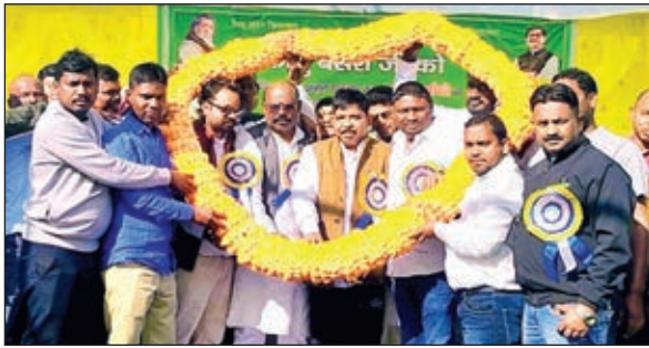
51 किलो का माला पहनाकर अतिथियों का स्वागत करते लोग।