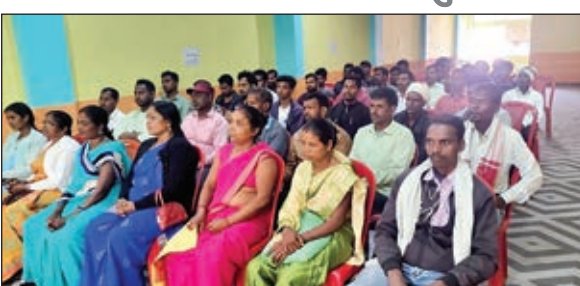
सम्मेलन में शामिल पार्टी के कार्यकर्ता