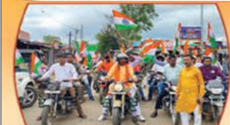
पांकी विधानसभा क्षेत्र में निकाली गई तिरंगा यात्रा

डॉ मेहता ने ठाना है, पांकी विधानसभा से खानदानी दबंगता को मिटाना है