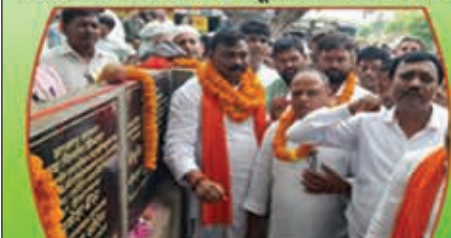
सगालीम से पदमा तक पथ निर्माण का शिलान्यास

कोरोना काल के बाद अल्प अवधि में महत्वपूर्ण उपलब्धियां—