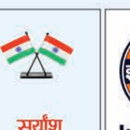
सुर्याश इंडियन गैस लातेहार