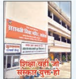
सरस्वती विद्या मंदिर लातेहार