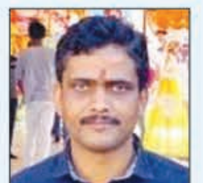
पारस प्रसाद प्रसाद ट्रेडर्स लातेहार