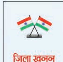
जिला खनन विभाग परिवार लातेहार