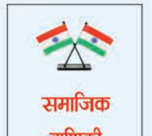
समाजिक वाणिकी परिवार लातेहार