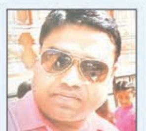
बंधन लॉग जिला आपूर्ति पदाधिकारी लातेहार