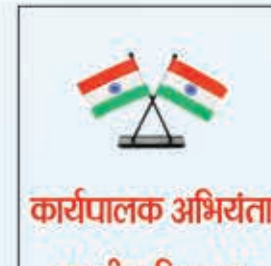
कार्यपालक अभियंता ग्रामीण विकास विशेष प्रमण्डल लातेहार