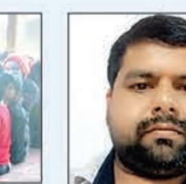
एस. एस. एन. मेमोरिखल स्कूल पतरिया चोटाग, लातेहार