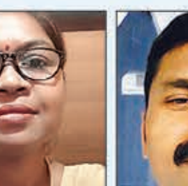
बिलासी तोपनो केन्द्रीय समिति सदस्य लातेहार