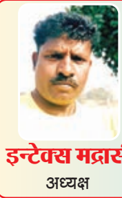
इन्देक्स मद्रासी अध्यक्ष