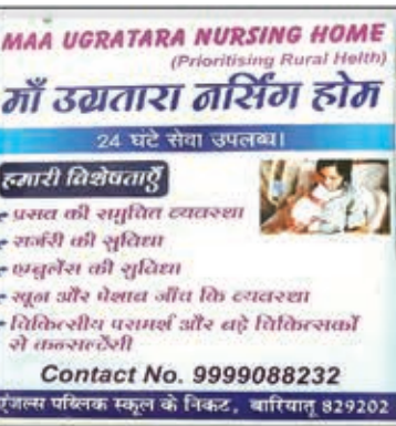
जय माँ उग्रतारा नर्सिंग होम बारियातू