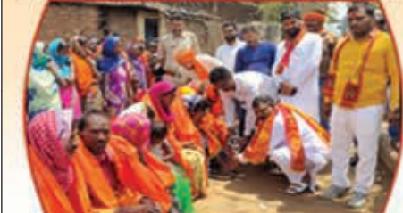
आदिवासी बहुल कनौदा गांव में देव तुल्य जनता का पैर पूजन