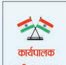
कार्यपालक अभियंता पथ निर्माण विभाग लातेहार