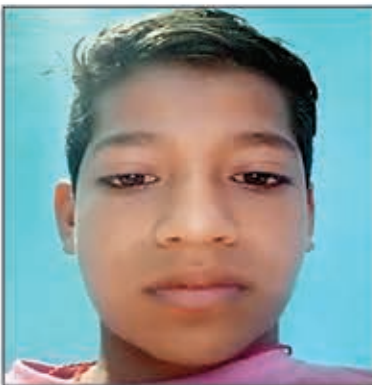
शुभचिंतक खबर मन्त्र