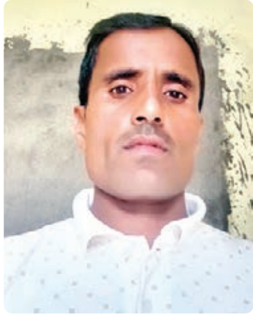
अखिलेश यादव भाजपा नेता हेरहंज