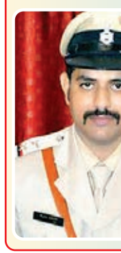
थाना प्रभारी मैक्लुस्कीगंज