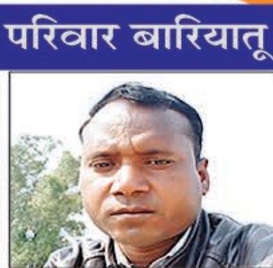
लाखो भुइयाँ कोषाध्यक्ष