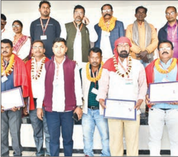
नवनियुक्त कमिटी के साथ यूनियन के पदाधिकारीगण