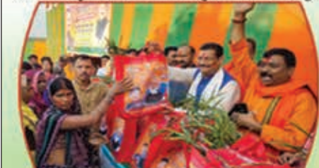
32000 छठ ब्रतियों के बीच पूजन सामग्री का वितरण