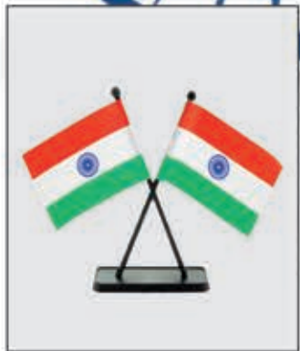
प्राथमिक शिक्षक संघ बारियातू