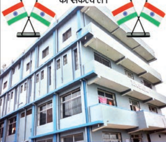
तापा लाइफ लाइन हॉस्पिटल

आइये इस गरिमामयी दिवस पर जिले में बेहतर स्वास्थ्य व्यवस्था उपलब्ध कराने का संकल्प लें।