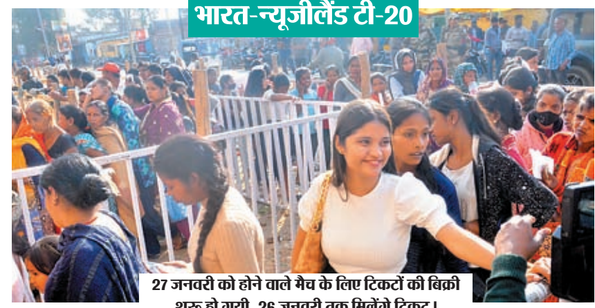
27 जनवरी को होने वाले मैच के लिए टिकटों की बिक्री शुरू हो गयी, 26 जनवरी तक मिलेंगे टिकट।