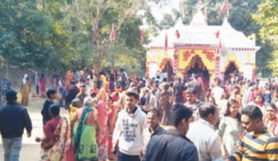
जगन्नाथ मंदिर में पूजा-अर्चना करते लोग।