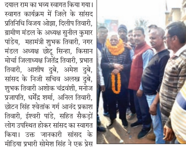
सांसद का स्वागत करते पलामू के लोग।

मेदिनीनगर। करीब 83 वर्षों से लंबित चिरमिरी रेल लाइन का पुनः कार्य प्रारंभ करने की स्वीकृति मिलने पर पलामूवासियों में हर्ष का माहौल है। इसके लिए लगातार प्रयासरत भारतीय जनता पार्टी के पलामू सांसद विष्णु दयाल राम, जो कई बार सदन में इस पर आवाज उठाये एवं लगातार भारत सरकार रेल मंत्रालय से चिरमिरी रेल लाइन को पूरा करने के लिए प्रयासरत रहे। शनिवार को सांसद विष्णु दयाल राम के पलामू आगमन पर रेडमा चौक स्थित अमृत हॉटल के पास, भारतीय जनता पार्टी ग्रामीण मंडल मेदिनीनगर के नेतृत्व में लोकप्रिय सांसद विष्णु