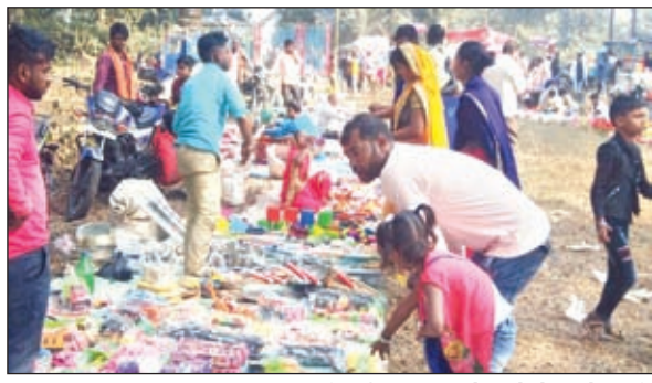
राम-जानकी मंदिर प्रांगण में लगे मेला में खरीदारी करते लोग, अर्घ्य कर्तन में शामिल श्रद्धालु।

के लिए श्रद्धालुओं की भारी भीड़ उमड़ी रही। साथ ही आस्था का केंद्र राम-जानकी मंदिर में पूजा के लिए श्रद्धालुओं का तांता लगा रहा। इस दौरान न केवल कोयलांचल भुरकुंडा बल्कि दूर-दराज क्षेत्रों से लोग नदियों में पवित्र स्नान के लिए पहुंचे। साथ ही घरों में भी लोगों ने स्नान-ध्यान कर पूजा-पाठ के बाद नियम पूर्वक दान-पुण्य भी किया। मकरसंक्रांति के अवसर पर सुबह में दही, चूड़ा, गुड़ व तिलकुट खाने-खिलाने का दौर भी चला। इस दौरान लोग एक-दूसरे के घर जाकर चूड़ा-तिलकुट का लुफ उठाते हुए लोगों ने पर्व की बधाई दी। इधर इस बार रविवार को भी