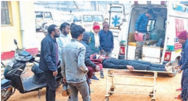
घायल को इलाज के लिए अस्पताल ले जाते लोग।