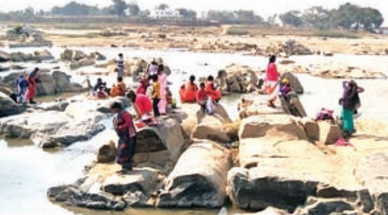
नागफेनी नदी में स्नान लगाने पहुंचे लोग।

मंदिर का पट अहले सुबह खोल दिया गया। सुबह से ही भगवान के दर्शन पूजन के लिए भक्तों की भीड़ उमड़ पड़ी। पुरोहितों ने वैदिक मंत्रोच्चारण के साथ भक्तों के फल, फूल व प्रसाद को भगवान पर भोग लगाया। भक्त गण हाथ जोड़कर भगवान से सुख शांति व समृद्धि की कामना की। मंदिर के बाहर आरती की थाल लेकर पुरोहित भक्तों को चंदन लगा रहे थे और रक्षा सूत्र बांधकर दक्षिणा ले रहे थे। वहीं गरीब भिक्षुक भी पर्व मनाया। प्राकृतिक सौंदर्य और धार्मिक आस्था का केन्द्र नागफेनी में मंदिर परिसर में चांदर फैलाए दाताओं का इंजतार कर रहे थे। मंदिर में पूजा अर्चना के बाद श्रद्धालु गरीबों को दान करते देखे गए। यह सिलसिला अपराह तक चलता रहा। नागफेनी के मकर संक्रांति मेला में काफी दूर-दूर से भी लोग आये थे।