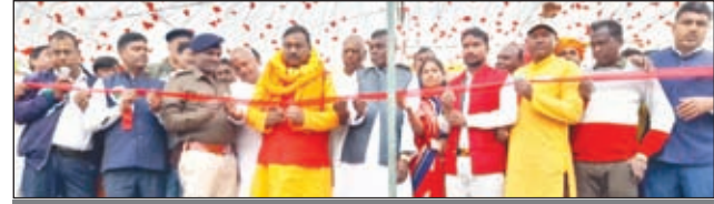
तरहसी प्रखंड में दो विधायक प्रतिनिधि नियुक्त