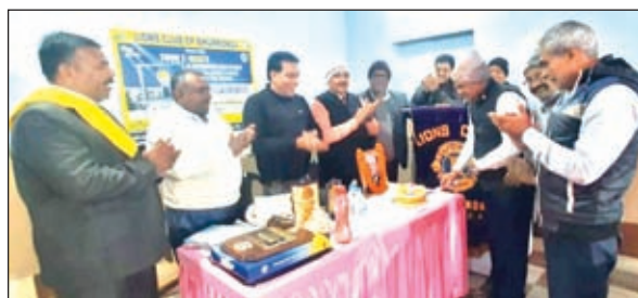
कार्यक्रम में मौजूद लायंस क्लब के लोग।