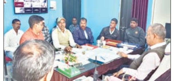
वार्ता करते लोग।