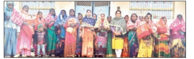
कंबल वितरण करतीं मुखिया।