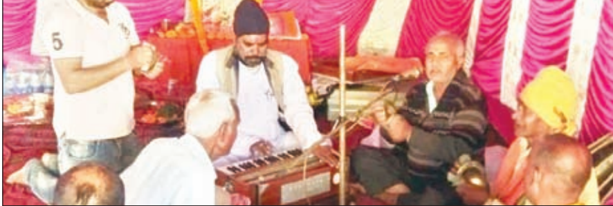
अखंड हरिकीर्तन में शामिल श्रद्धालु।