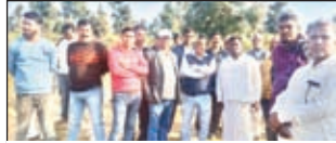
मौके पर विधायक समेत आम जनता।