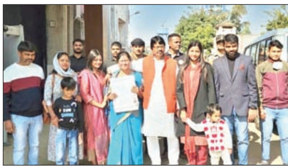
विधायक अंबा प्रसाद व अन्य।