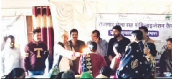
मौके पर उपस्थित लोग।

317 अभ्यर्थियों के आवेदन को पंजीकृत किया गया। सलेक्टड अभ्यर्थियों को प्रशिक्षण दिया जाएगा प्रशिक्षण के उपरांत रोजगार उपलब्ध करवाया जाएगा। रोजगार मेले में रांची व हजारीबाग के एजेंसी शामिल थे, आनंद बुक इंटरनेशनल प्राइवेट लिमिटेड, लॉजिक प्रो कंसल्टिंग,एनईएम एजुकेशनल फाउंडेशन, एमएस सर्पोट, मां सरस्वती, राधा गोविंद, जीसीएस