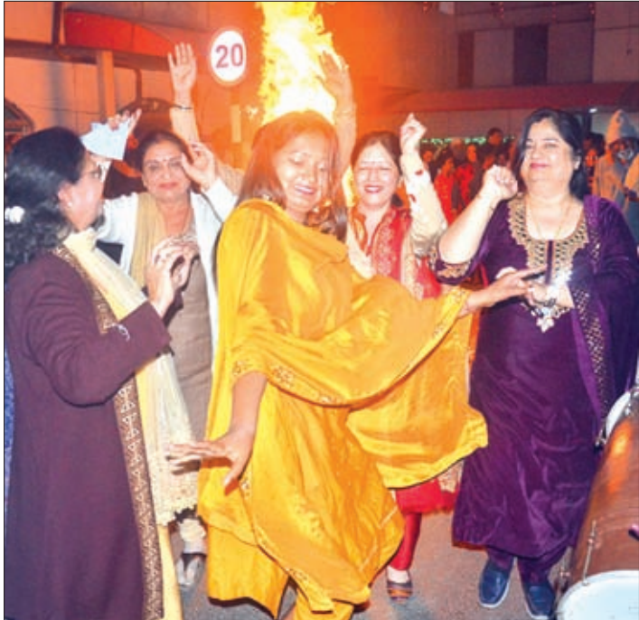
राजधानी के कई इलाकों में शुक्रवार को पंजाबी हिंदू विरादटी के सदस्यों ने धूमधाम से लोहड़ी पर्व मनाया और खुशी का इजहार किया।

31 से संसद सत्र, 1 फरवरी को बजट पेश करेंगी वित्त मंत्री