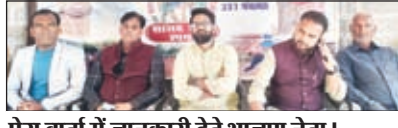
प्रेस वार्ता में जानकारी देते भाजपा नेता।

चंदवा। आगामी 18 से 20 जनवरी तक नेतरहाट में आयोजित होने वाले तीन दिवसीय सांसद खेल स्पर्धा को