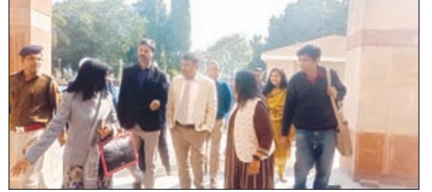
निरीक्षण करते अधिकारी।