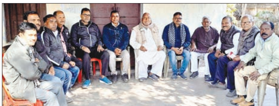
बैठक में उपस्थित सीटू के लोग।

है। 144 श्रम कानून को 4 लेबर कोड में बदल दिया गया है। किसानों को केंद्र सरकार द्वारा एमएसपी नहीं दिया जा रहा है। उन्होंने कहा कि केंद्र सरकार के गलत नीतियों के खिलाफ एकजुट होकर आंदोलन में जाना होगा। साथ ही केंद्र सरकार के राष्ट्र विरोधी, जन विरोधी, कॉरपोरेट परस्त विभाजनकारी नीतियों व आम आवाज के अधिकारों के लिए 5 अप्रैल को दिल्ली में चार केंद्रीय ट्रेड यूनियन के आह्वान पर मजदूर-