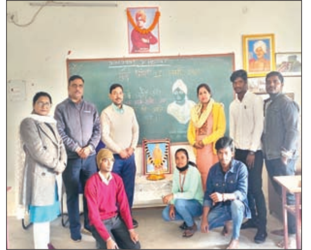
कार्यक्रम में शामिल लोग।