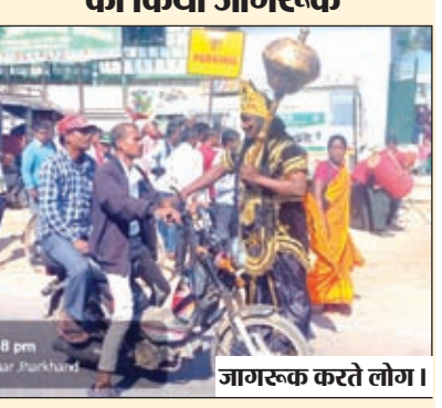
जागरूक करते लोग।