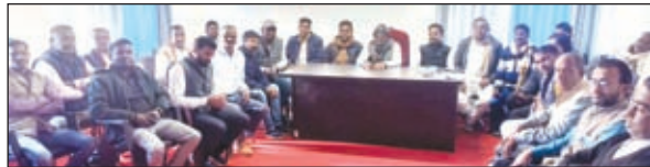
बैठक में शामिल कांग्रेस पार्टी के कार्यकर्ता।