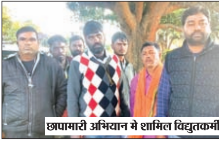
छापामारी अभियान में शामिल विद्युतकर्मी।