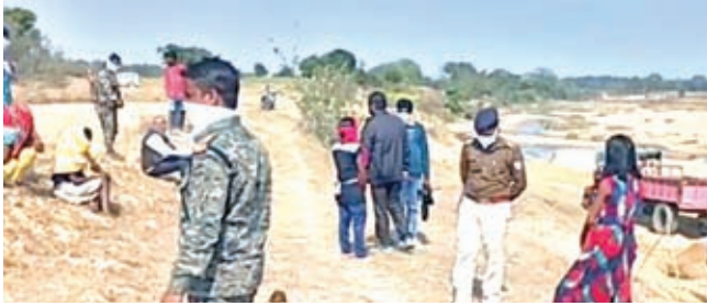
दफनाये गये स्थान से शव निकालने पहुंची पुलिस ।