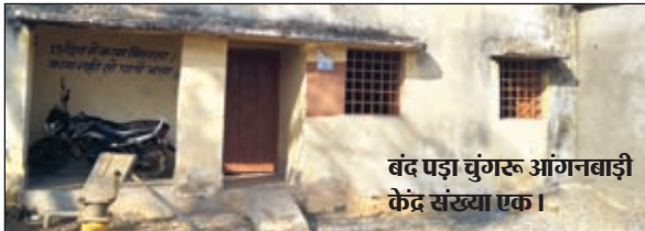
बंद पड़ा चुंगरू आंगनबाड़ी केंद्र संख्या एक।

बरवाडीह। शासन भले ही आंगनबाड़ी केंद्रों की दशा सुधारने को लेकर तमाम तरह के निर्देश जारी करते रहती है। बावजूद बाल विकास विभाग की सुस्ती के चलते बरवाडीह प्रखंड के ग्रामीण क्षेत्रों के कई आंगनबाड़ी केंद्रों पर ताला लटक रहता है। गिने-चुने केंद्रों पर मुद्दीभर बच्चों को बैठाकर केंद्र के संचालन की औपचारिकता जरूर निभाई जाती है। आंगनबाड़ी सेविका व सहायिका के मनमाने रवैये से केंद्रों पर गर्भवती, धात्री, किशोरी व नौनिहालों की सेहत सुधारने के लिए दिया जाने वाला पोषाहार इन्हें न मिलकर पशुओं का आहार बन गया है।