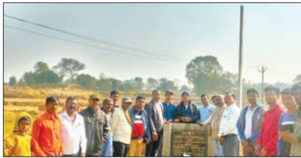
मौके पर उपस्थित लोग।

नगर परिषद अध्यक्ष ने फीता काटकर किया उद्घाटन