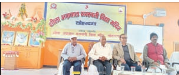
कार्यक्रम में मौजूद अतिथि