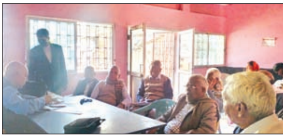
बैठक में शामिल सदस्य