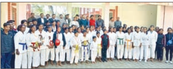
विजेता खिलाड़ियों के साथ डीसी व अन्य