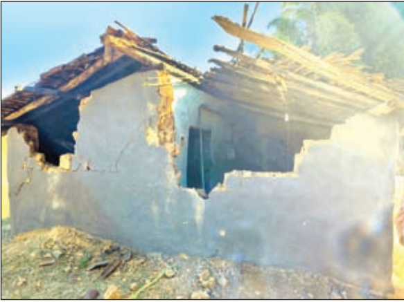
हाथी के द्वारा क्षतिग्रस्त घर