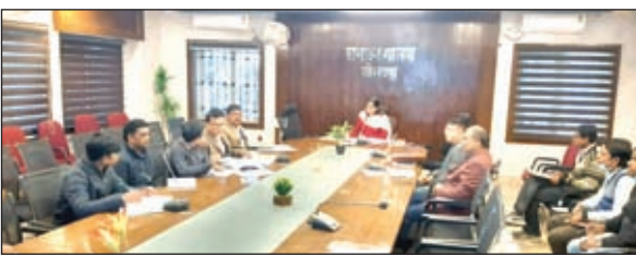
बैठक करती डीडीसी