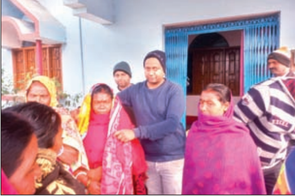
कंबल का वितरण करते