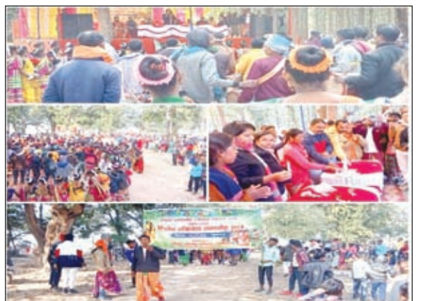
समारोह में शामिल लोग