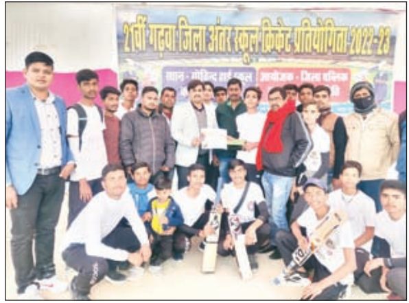
पुरस्कार देते बाजार समिति के सचिव व अन्य