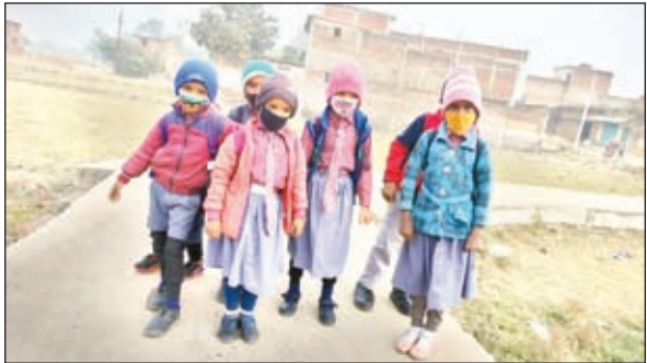
स्कूल जाते बच्चे