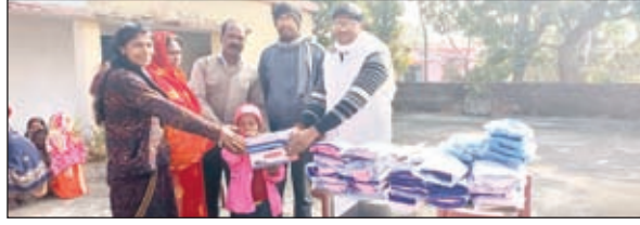
पोशाक प्राप्त करते बच्चे

इचाक। उत्कर्मित प्रथमिक विद्यालय रविदास टोला सिड्डुआ में कक्षा एक एवं द्वितीय में नामांकित 28 बच्चों के बीच दो जोड़ी पोशाक, स्वेटर, जुता एवं मौजा बांटी गई। वितरण