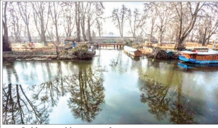
तापमान गिरने के कारण जमने के कगार पर डल झील।

है। बिहार के कई शहर और जिलों में पिछले तीन दिनों से कड़ाके की ठंड पड़ रही है। गुरुवार को यहां का तापमान 8 डिग्री पहुंच गया है और अधिकतम तापमान 21 डिग्री दर्ज किया गया है। यहां 26 सालों बाद बुधवार सबसे सर्द दिन रहा। समस्तीपुर जिले में न्यूनतम तापमान 8 डिग्री सेल्सियस दर्ज किया गया। राजस्थान में शिमला और श्रीनगर से भी ज्यादा सर्दी रिकॉर्ड हुई। सबसे ठंडा मार्डेट आबू रहा।