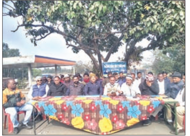
प्रेस वार्ता में एसोसिएशन के पदाधिकारी व अन्य