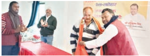
जिला संगठन प्रभारी का स्वागत करते जिला अध्यक्ष