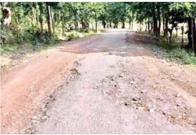
टांगीनाथ धाम जाने वाली जर्जर सड़क का हाल

7.5 किलोमीटर, नौनी से आदर 7.5 किलोमीटर, भरनो से गुलैची टोली अर्मलिया जतरागाडी से अंबाटोली तक 10 किलोमीटर, भरनो प्रखंड के दुबुनो से पबिया बांध से बटकुरा तक 9.5 किलोमीटर, बिशुनपुर प्रखंड के चटकपुर से तेंदर तक 10 किलोमीटर, चैनपुर प्रखंड के गम्हरिया से टोंगो भाया लालगंज 9. 5 किलोमीटर, भेलावा टोली से लंगड़ा मोड़ तक भाया सुगसरवा तक 11 किलोमीटर, छतरपुर से हरा तक 10 किलोमीटर सड़क शामिल है। सांसद सुदर्शन भगत ने कहा है कि क्षेत्र के ग्रामीणों की मांग पर इन