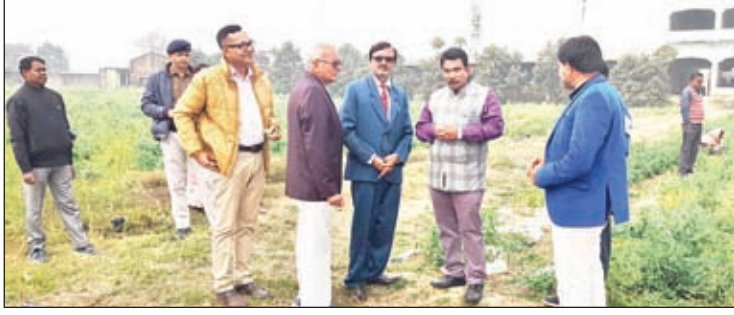
खेत में लगी फसल को देखते व जानकारी लेते कृषि सचिव।