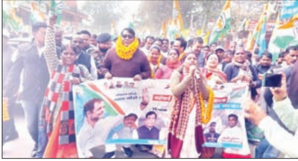
यात्रा में शामिल मंत्री व अन्य

एकता, सांस्कृतिक विविधता और भारत वासियों के अविश्वसनीय धैर्य का उत्सव है एक तरफ बीजेपी , आरएसएस के लोग देश को बांटने के लिए फूट डालो राज करो कि राजनीति कर रही है और अडानी अंबानी जैसे व्यापारियों से मिलकर देश कि संपत्ति को बेचने का काम कर रहे हैं लेकिन कांग्रेस पार्टी इसके खिलाफ गांधी जी के विचारधारा के साथ आवाज उठाते रहेगी। कार्यक्रम