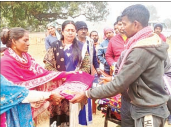
कंबल वितरण करते जिला सदस्य व अन्य