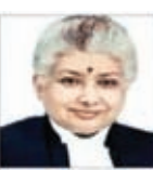
जस्टिस वीवी नागरबा

हालांकि 5 जजों की बेंच में से जस्टिस वीवी नागरबा का मत अलग था और उन्होंने इस पर कुछ सवाल उठाये। जस्टिस नागरबा ने बाकी चार जजों की राय से अलग फैसला लिखा। उन्होंने कहा कि नोटबंदी का फैसला गैरकानूनी था। इसे गलत नोटिफिकेशन की जगह कानून के जरिए लिया जाना था। हालांकि उन्होंने कहा कि इसका सरकार के पुराने फैसले पर कोई असर नहीं पड़ेगा। नोटबंदी के खिलाफ दायर याचिकाओं में कहा गया था कि इससे अर्थव्यवस्था पर असर हुआ और तमाम लोगों को इससे परेशानी उठानी पड़ी। अदालत में सरकार ने अपना रिपोर्ट भी सुनवाई के दौरान पेश किया।