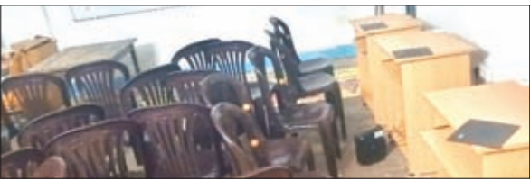
विद्यालय का आईसीटी लैब रूम