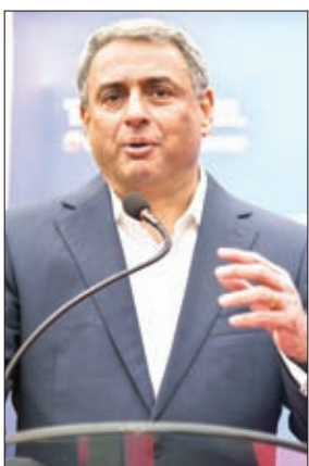
एकीकरण प्रक्रिया पूरी : एक सवाल पर उन्होंने कहा कि टाटा

जमशेदपुर। टाटा स्टील लिमिटेड के जमशेदपुर स्टील प्लांट अब उत्पादन और विस्तार के चरम बिंदु पर पहुंच गया है। दुनिया में जमशेदपुर को छोड़ शायद ही कोई 10 मिलियन टन सालाना उत्पादन क्षमता वाला प्लांट आबादी के बीच उत्पादनरत हो। इसलिए टाटा स्टील अब अपने जमशेदपुर स्टील प्लांट की जगह अपनी सहयोगी डाउन स्ट्रीम उद्योगों टिनप्लेट कंपनी, आइएसडब्ल्यूपी एवं अन्य उद्योगों में निवेश कर रही है जिससे शहर में नये अवसर पैदा होंगे।