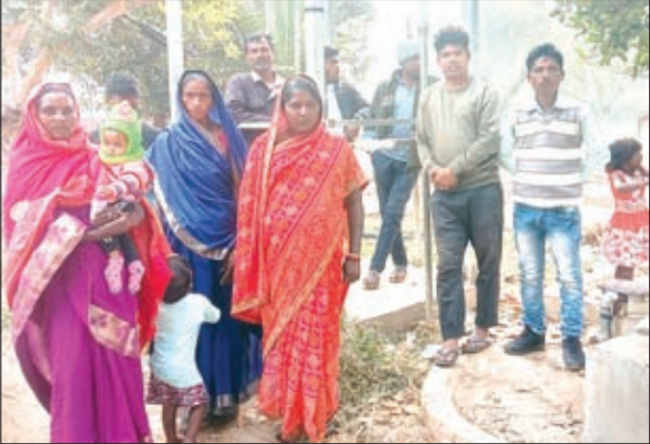
जल मीनार बनाने की मांग करते ग्रामीण