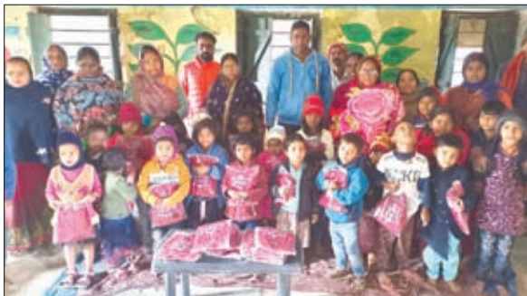
बच्चों के बीच स्टेटर वितरण करते मुखिया

बच्चों के विकास की बुनियादी सीढ़ी है आंगनवाड़ी केंद्र : कालो देवी