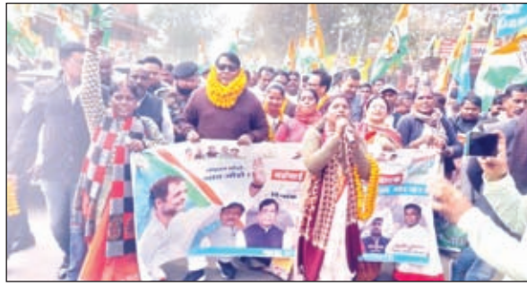
यात्रा में शामिल मंत्री व अन्य

एकता, सांस्कृतिक विविधता और भारत वासियों के अविश्वसनीय धैर्य का उत्सव है एक तरफ बीजेपी , आरएसएस के लोग देश को बांटने के लिए फूट डालो राज करो कि राजनीति कर रही है और अडानी अंबानी जैसे व्यापारियों से मिलकर देश कि संपत्ति को बेचने का काम कर रहे हैं लेकिन कांग्रेस पार्टी इसके खिलाफ गांधी जी के विचारधारा के साथ आवाज उठाते रहेगी। कार्यक्रम