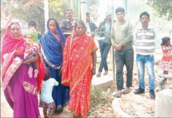
जल मीनार बनाने की मांग करते ग्रामीण