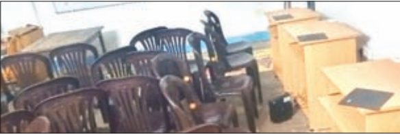
विद्यालय का आईसीटी लैब रूम