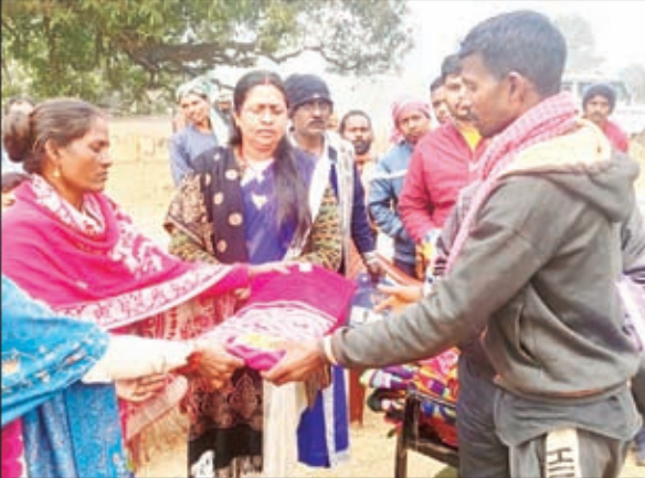
कंबल वितरण करते जिय सदस्य व अन्य

भगाने में दिलचस्पी नहीं दिखा रही है, विभाग चाहती तो हांथियों को बफरजोन में खदेड़कर ग्रामीणों को हांथियों के आतंक से निजात दिला सकते थे।