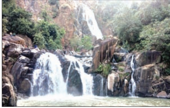
लोथ फॉल ।