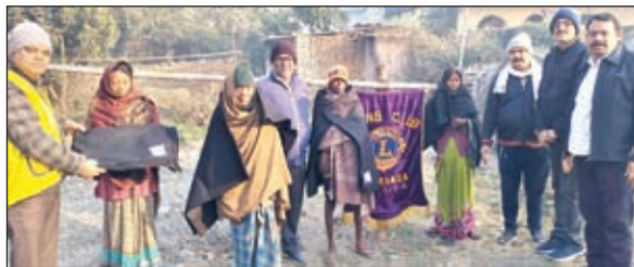
गरीबों के बीच कंबल का वितरण करते वलब के लोग।