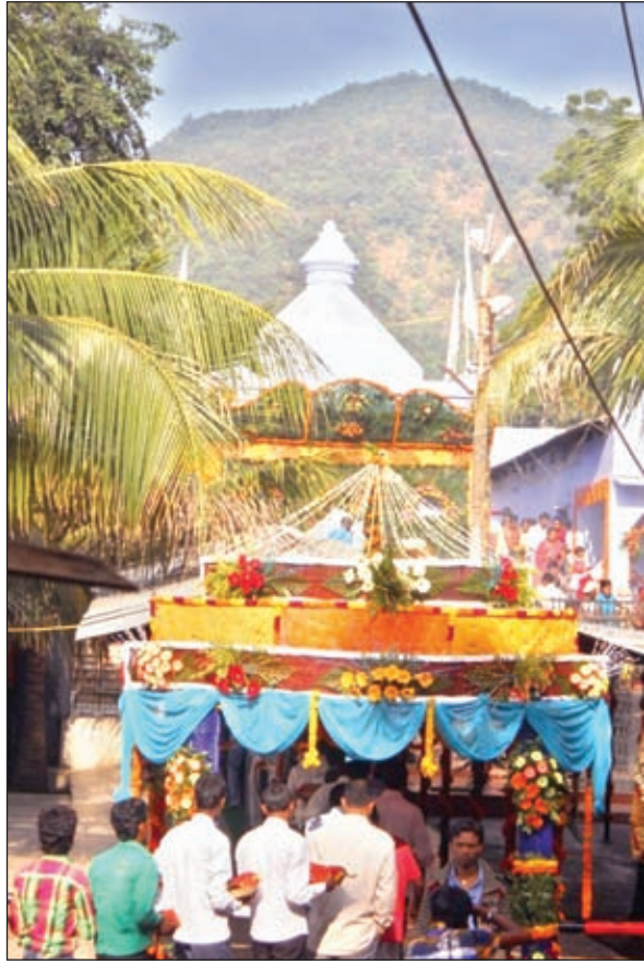
नगर मंदिर ।