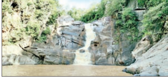
डामत पातम जलप्रपात ।

नेतरहाट पर्यटन स्थल पूरे विश्व में प्रसिद्ध है, यहां से सनसेट एवं सनराइज के दृश्य को देखने के लिए प्रतिवर्ष हजारों लोग आते हैं