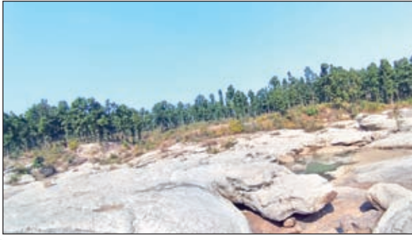
दारू के पिकनिक स्पॉट।

वनभोज के बहाने यहां समय गुजार सकें। दारू प्रखंड मुख्यालय से महज 3 किलोमीटर दूर दारू पंचायत के बासोभार मार्ग से होते