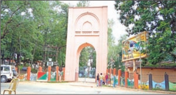
बेतला पार्क ।