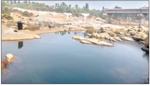
दारू के पिकनिक स्पॉट।

दारू। दारू प्रखण्ड में दर्जनों खूबसूरत पिकनिक स्पॉट है जिसमें आज एक जनवरी को नव वर्ष के मौके पर पिकनिक मनाने आने वाले सैलानियों की भारी भीड़ उमड़ेगी। यहां पर सिवाने नदी के अनेक पिकनिक स्पॉट जैसे धोरधोरवा, भूखला नदी, इंद्रवा, पेटी नदी, मेढकुरी नदी कोनार नदी के कवालु, दिवार, जिन्गा आदि जगहों पर कई पिकनिक स्पॉट है जो सैलानियों के लिए आकर्षण का केंद्र है। इनमें हर किसी की पहली पसंद सेवाने नदी और उसकी