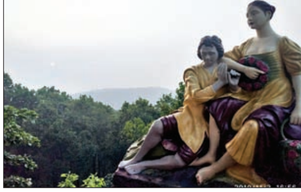
मंगोलिया प्लाईट नेतरहाट ।