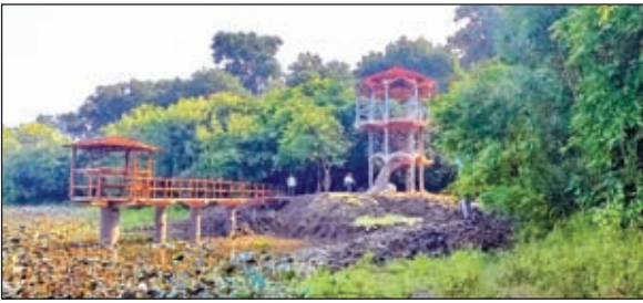
कमलदह झील ।

देशों से बेतला आते रहते हैं। पक्षियों से प्रेम करने वाले व शोधकर्ता बेतला आकर पक्षियों के बारे में अध्ययन भी करते रहते हैं। बेतला के प्रमुख पर्यटन स्थलों की जानकारी : ततहा जलप्रपात, मिर्चाइया जलप्रपात, सुगाबांध जलप्रपात लोथ जलप्रपात ये सभी पर्यटक स्थल को देखने के बाद पर्यटकों का यहां से जाने का मन नहीं करता। बेतला नेशनल पार्क : बेतला नेशनल पार्क के मुख्य द्वार से प्रवेश करते ही जानवरों का दिखना शुरू हो जाता है हिरण, बंदर, हनुमान तो गेट के पास ही दिखते हैं। पार्क के