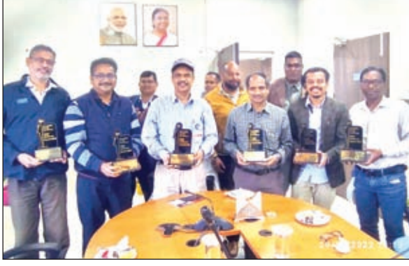
एनटीपीसी के अधिकारी।

कंपनियों में नौकरी दी गई। इसी तरह कैपेसिटी बिल्डिंग की बात करें तो योजना से प्रभावित महिलाओं को सिलाई एवं मशरूम की खेती करने के लिए प्रशिक्षण दिया गया जिससे आज वो स्वावलंबी बन पाई है। एनटीपीसी ने आसपास के क्षेत्रों में स्वास्थ्य सुविधाओं को बेहतर करने के लिए इस साल 91 मेडिकल कैंप