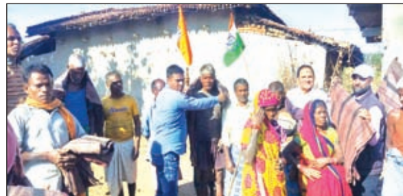
कंबल वितरण करते कार्यकर्ता।