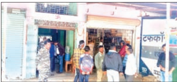
जांच करने पहुंचे विभाग के अधिकारी।

महुआडांड। प्रखंड में संचालित सरकारी शराब दुकानों में शराब बिक्री में मनमानी पैसा वसूला जा रहा है। इस संबंध में कई ग्राहकों ने शिकायत करते हुए बताया कि शराब बिक्री में सभी कंपनी के क्वार्टर से लेकर फूल तक में 20 से 200 रुपये तक ग्राहकों से ज्यादा लिया जा रहा है। खरीदारों को रेट बढ़ने की बात कह कर मनमानी वसूली की जा रही है। जबकि मिलाभगत दर्जनों प्राइवेट स्थलों पर अधिक दामों में शराब की बिक्री हो रही है। जिससे रोजाना शराब दुकान में रेट को लेकर ग्राहकों और सेल्समैन