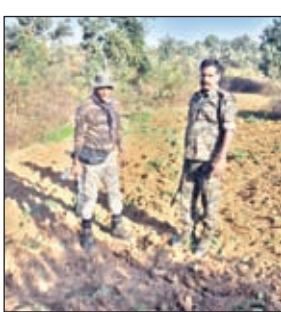
पोस्ते की खेती को नष्ट करती पुलिस

वहीं अफीम खेती करने वाले वाले लोगों को चिन्हित किया जा रहा है। चिन्हित कर एफआईआर दर्ज किया जाएगा। उक्त अभियान