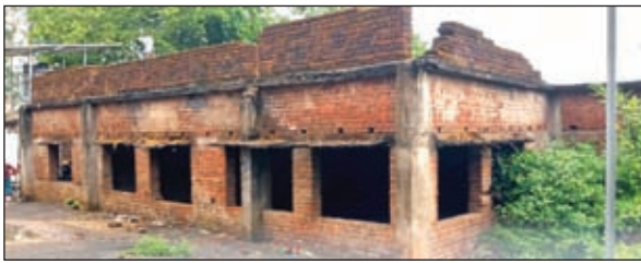
पूर्व में बन रहा भवन।

ग्रामीणों ने मांग करते हुए कहा कि अर्धनिर्मित भवन को तोड़कर उसी जगह पर नया अस्पताल बनाया जाए। वहीं बालूमाथ में डिग्री कॉलेज नहीं होने के कारण बच्चों को अपनी पढ़ाई पूरी करने के लिए बड़े शहरों का रुख करना पड़ता