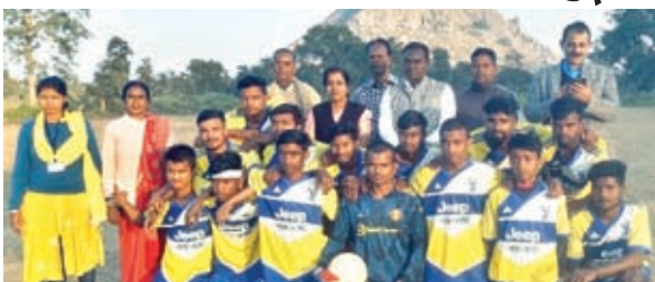
विजेता टीम के साथ अतिथि गण

सिल्ली। सिल्ली पटका फुटबॉल मैदान में बुधवार को खेल मंत्रालय भारत सरकार की ओर से नेहरू युवा केंद्र रांची के द्वारा आयोजित दो दिवसीय प्रखंड स्तरीय खेलकूद प्रतियोगिता संपन्न हो गया। प्रतियोगिता में फुटबॉल एवं दौड़ प्रतियोगिता का आयोजन किया गया। फुटबॉल प्रतियोगिता में आस पास की 8 टीमों ने हिस्सा लिया। फाइनल में केशरडीह फुटबॉल क्लब ओर