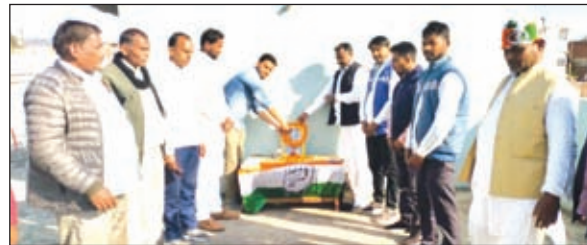
स्थापना दिवस मनाते कांग्रेस के कार्यकर्ता।