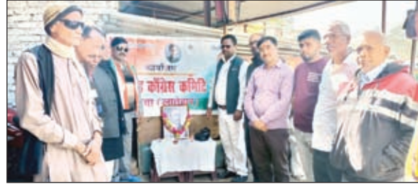
स्थापना दिवस मनाते कांग्रेसी।