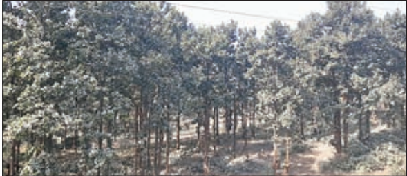
जंगल के पेड़ों पर धूल जमने से हुई हरियाली गायब।

ओरमांडी। डुंडे जंगल के हरे-भरे साल के पेड़ों की हरियाली गायब हो गई है। यह समस्या थाना क्षेत्र के डुंडे स्थित एनएच-20 पथ से कुछ ही दूर पर कई बड़े-बड़े क्रशर का संचालन होने से हुई है। डुंडे जंगल के सभी पेड़-पौधों में क्रशर से उड़ने वाली धूल के परत जम गई है। सड़क से गुजरते जिन लोगों के आंखों में जंगल की हरियरली सुकून देती है। अब क्रशर से उड़ती धूल उन्ही आंखों के लिए खतरा बन गई है। बाइक पर हो तो बिना चश्मे के