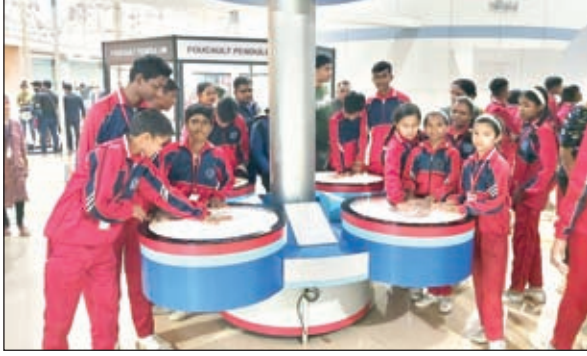
शैक्षणिक भ्रमण के दौरान आइलेक्स के विद्यार्थी ।

बरही। पंचमाघव स्थित आइलेक्स पब्लिक स्कूल के विद्यार्थियों छुट्टियों के दौरान शैक्षणिक भ्रमण पर कोलकाता जैसे महानगर की स्थिति से अवगत हुए। बताते चलें कि आइलेक्स पब्लिक स्कूल में बच्चों के लिए छुट्टियों के दौरान कई ऐतिहासिक जगहों पर शैक्षणिक भ्रमण का आयोजन किया है। जिसके प्रथम चरण में बच्चे राजगीर नालंदा जाकर वहां के भौगोलिक व ऐतिहासिक स्थिति से अवगत किया गया। दूसरे चरण में बच्चों को कोलकाता ले जाया गया विद्यालय में अध्ययनरत 45 बच्चों की टीम