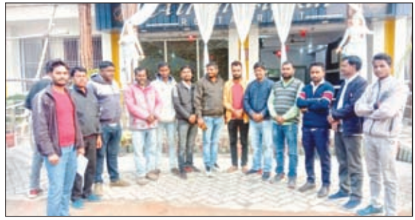
विष्णुगढ़ मुखिया संघ का गठन किया गया ।