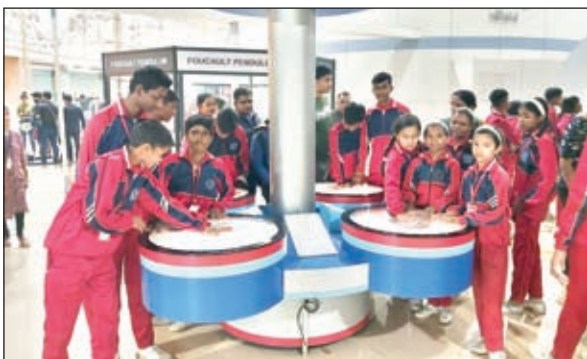
शैक्षणिक भ्रमण के दौरान आइलेक्स के विद्यार्थी ।

बरही। पंचमाघव स्थित आइलेक्स पब्लिक स्कूल के विद्यार्थियों छुट्टियों के दौरान शैक्षणिक भ्रमण पर कोलकाता जैसे महानगर की स्थिति से अवगत हुए। बताते चलें कि आइलेक्स पब्लिक स्कूल में बच्चों के लिए छुट्टियों के दौरान कई ऐतिहासिक जगहों पर शैक्षणिक भ्रमण का आयोजन किया है। जिसके प्रथम चरण में बच्चे राजगीर नालंदा जाकर वहां के भौगोलिक व ऐतिहासिक स्थिति से अवगत किया गया। दूसरे चरण में बच्चों को कोलकाता ले जाया गया विद्यालय में अध्ययनरत 45 बच्चों की टीम