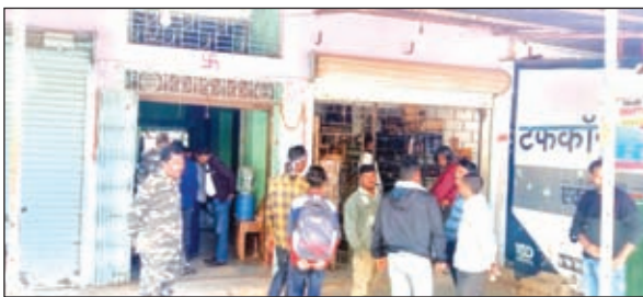
जांच करने पहुंचे विभाग के अधिकारी।

महुआडांड। प्रखंड में संचालित सरकारी शराब दुकानों में शराब बिक्री में मनमानी पैसा वसूला जा रहा है। इस संबंध में कई ग्राहकों ने शिकायत करते हुए बताया कि शराब बिक्री में सभी कंपनी के क्वार्टर से लेकर फूल तक में 20 से 200 रुपये तक ग्राहकों से ज्यादा लिया जा रहा है। खरीदारों को रेट बढ़ने की बात कह कर मनमानी वसूली की जा रही है। जबकि अफीम प्रिंट रेट में कोई बदलाव नहीं किया गया है। आलम यह है कि दुकानों पर तो डेढ़ से दो गुना राशि तक ग्राहकों से वसूली की जा रही