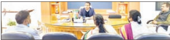
बैठक करते उपायुक्त व अन्य।

विलम्ब से होने की वजह से बुआई नहीं कर पाये कटेपरी ए के किसानों द्वारा मुख्यमंत्री सुखाड़ राहत योजना के लाभ हेतु दिये गए आवेदनों पर विचार विमर्श किया गया। अंचल एवं अनुमंडल स्तरीय पदाधिकारियों के द्वारा आवेदनों के