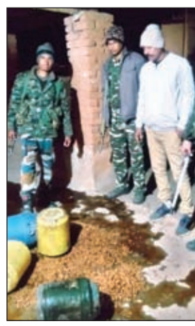
शराब को नष्ट करती पुलिस।