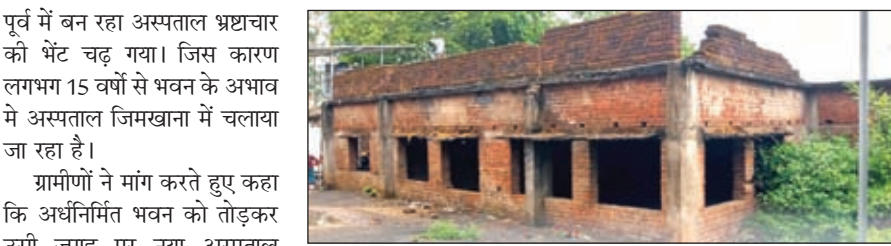
पूर्व में बन रहा भवन।