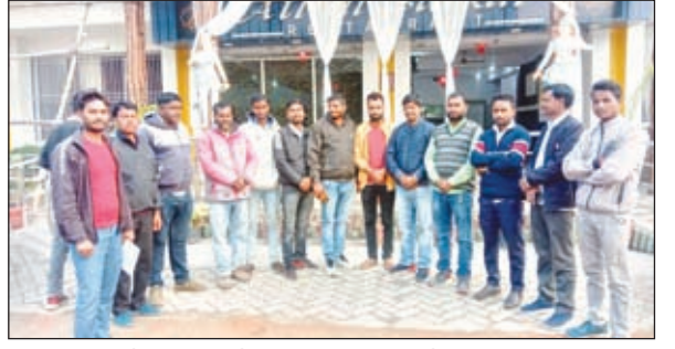
विष्णुगढ़ मुखिया संघ का गठन किया गया ।