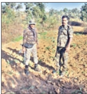
पोस्ते की खेती को नष्ट करती पुलिस

वहीं अफीम खेती करने वाले वाले लोगों को चिन्हित किया जा रहा है। चिन्हित कर एफआईआर दर्ज किया जाएगा। उक्त अभियान