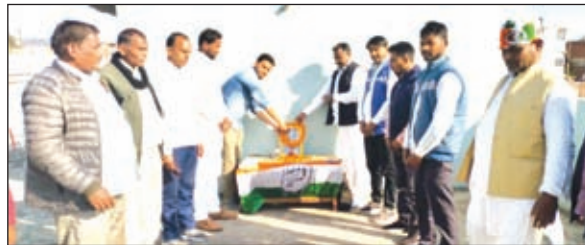
स्थापना दिवस मनाते कांग्रेस के कार्यकर्ता।