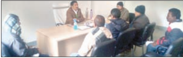
बैठक करते सीओ।

किसानों के दस्तावेज अंचल में जमा नहीं होगी उनका फसल राहत की