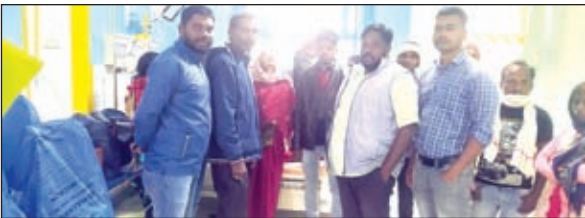
अस्पताल का निरीक्षण करते मिशन बदलाव के सदस्य।