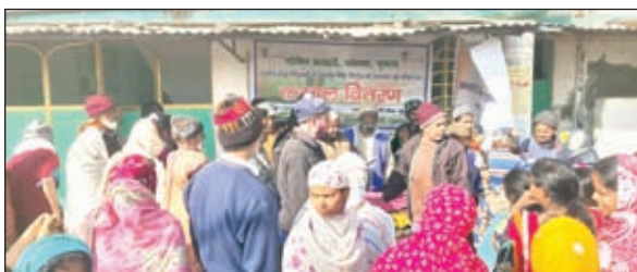
गरीबों के बीच कंबल का वितरण करते मोमीन पंचायत के सदस्य।