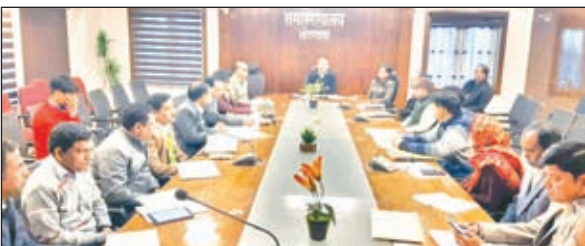
बैठक करते डीसी।