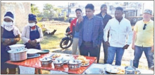
तैयार भोजन को देखते बीडीओ और उप प्रमुख।