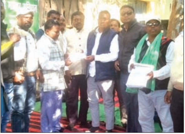
सदस्यता अभियान प्रांभ करते