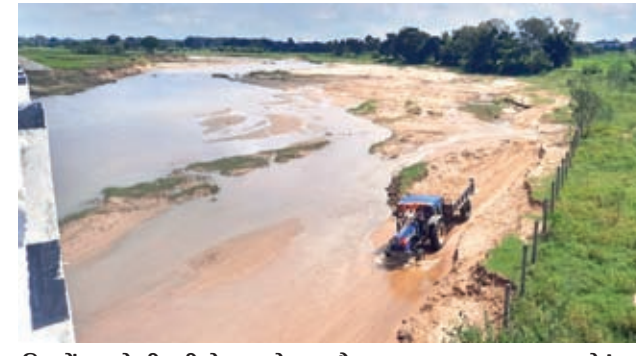
दिन में नागफेनी नदी से बालू ले जाता ट्रैक्टर।