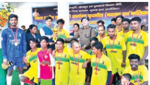
विजेता टीम को शील देते डीसी, डीएसपी व अन्य

मुख्यमंत्री आमंत्रण फुटबाल प्रतियोगिता के विजेता टीम को किया सम्मानित, कहा- राज्य स्तर पर प्रदर्शन कर जिले का नाम रोशन करें खिलाड़ी