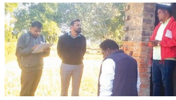
बेलागढ़ा पंचायत में गाय व बकरी शेड निर्माण की जांच करते एसडीओ।

मापी पुस्तिका मिला गायव, काम पूरा होने के बाद भी भुगतान नहीं किये जाने पर जतायी नाराजगी कहा- रिपोर्ट डीसी को सौंपेगे