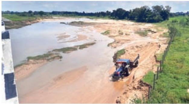
दिन में नागफेनी नदी से बालू ले जाता ट्रैक्टर।

► सीएम हेमंत सोरेन को अवैध खनन रोक लगाने के लिए अधिकारियों को दिया निर्देश ► सिखई में राजनीतिक लोग भी इस काले कारोबार को करके हो रहे हैं मालामाल ► सिखई के ऑलमुंडा नदी तट, नागफेनी नदी तट, सोगड़ा नदी तट, मुरगू पतरा टोली तट, करकरी नदी तट, सहिजाना कोईल नदी तट, बरगांव जिन्दा कोयल नदी तट, कुलंकरी पतरा टोली कोयल नदी घाट से बालू का अवैध उत्खनन जारी