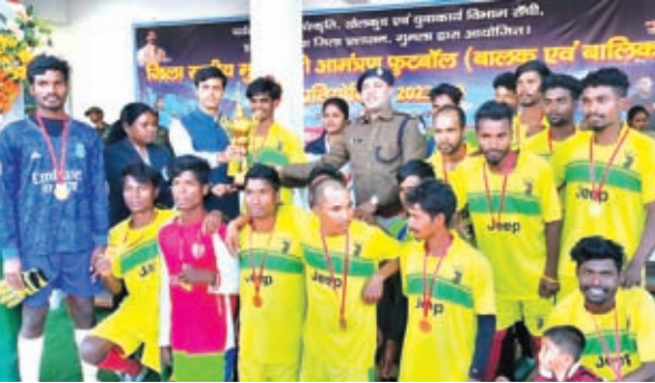
विजेता टीम को शिल्ड देते डीसी, डीएसपी व अन्य

गुमला। पर्यटन कला संस्कृति खेलकूद एवं युवा कार्य विभाग झारखंड सरकार व जिला प्रशासन गुमला के संयुक्त तत्वावधान में बुधवार को परमवीर अलर्ट एक्का स्टेडियम में जिला स्त्रीय मुख्यमंत्री आमंत्रण फुटबाल प्रतियोगिता हुआ। जिसमें बालक-बालिका दोनों वर्गों में फाइनल मैच खुला गया। बालक वर्ग में डुमरी व कामडारा के टीम के बीच मैच खेला गया। इस रोमांचक मुकाबले में डुमरी की टीम ने कामडारा की टीम को 2-0 गोल से पराजित किया। जिसमें बेस्टर स्कोरर