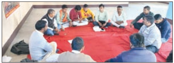
बैठक करते विहिप के लोग