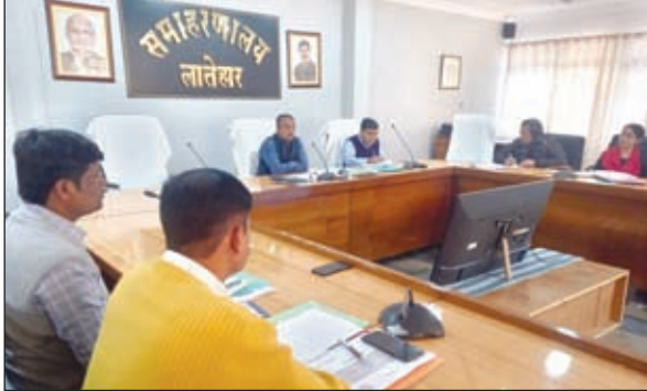
समीक्षा बैठक करते उपायुक्त

लातेहार। उपायुक्त भोर सिंह यादव की अध्यक्षता में नीति आयोग द्वारा निर्धारित मानक को लेकर जिले में हो रहे कार्यों की समीक्षा बैठक का आयोजन किया गया। बैठक में उपायुक्त ने कहा कि नीति आयोग के तहत किए जा रहे कार्यों में तेजी लाते हुए निर्धारित लक्ष्य को पूरा करना है। इसके लिए जिले के सभी पदाधिकारियों को अपनी जिम्मेदारी निर्भर की आवश्यकता है। बैठक में जिले के विकास से संबंधित निर्धारित विभिन्न प्रक्षेत्र में स्वास्थ्य, कृषि, पेयजल एवं स्वच्छता प्रमंडल, स्किल डेवलपमेंट, शिक्षा विभाग आदि से संबंधित कार्यों की बिंदुवार समीक्षा की गई। बैठक में जिला योजना पदाधिकारी द्वारा