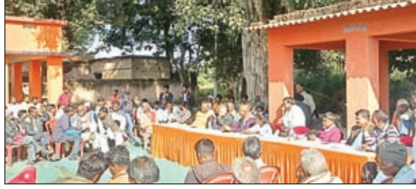
आम सभा में मौजूद ग्रामीण

अधिकांश का जमीन इधर का उधर हो गया। किसी का जमीन दूसरे रैयत के नाम चढ़ गया है, तो किसी का वन विभाग व अनाबाद