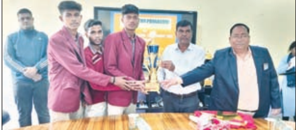
स्वागत करते जीएम

रजरप्पा। डीएवी रजरप्पा के सभागार में सोमवार को अलग-अलग खेलों से लौटे सभी विजेताओं को सम्मानित किया गया। ज्ञातव्य हो कि डीएवी नेशनल स्पोर्ट्स जोनल लेवल धनबाद, सीबीएसई क्लस्टर झ खोड़खो