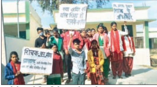
हाथों में तख्ती लिए विरोध प्रदर्शन करते छात्र-छात्राएं

विभाग की प्रतिनियोजन नीति से अंधकार में जा रहा है छात्र-छात्राओं का भविष्य