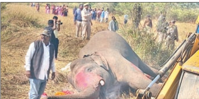
हाथी को दफनाने की प्रक्रिया करती वन विभाग की टीम। हाथी के शव की पूजा कर अंतिम विदाई देते बस्तीवासी।