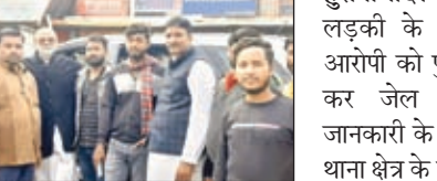
लोकसभा चुनाव के लिए टिकट भी देंगे। वे चुनाव लड़ेंगे। उन्होंने जनता के टिकट से चुनाव लड़ने की बात कही। हालांकि उन्होंने कहा कि अभी उनका लेस्लीगंज में आना है कोई राजनीतिक मतों का अच्छा नहीं था वे लातेहार में एक शादी समारोह में आये थे। यहां के कार्यकर्ताओं से उन्हें काफी लगाव है।

नीलांबर पीतांबरपुर। 2024 के लोकसभा चुनाव में चतरा के पूर्व सांसद अपनी किस्मत आजमायेंगे। चुनाव नजदीक देख पूर्व सांसद सक्रिय हो गये हैं। उन्होंने शनिवार को लेस्लीगंज आकर अपने पुराने कार्यकर्ताओं के साथ रायशुमारी की। इस दौरान पत्रकारों से बातचीत में उन्होंने कहा कि वे वर्तमान में भाजपा के सिपाही हैं और उम्मीद है कि पार्टी उन्हें आगामी