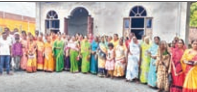
संबोधित करते हुए कहा कि प्रेम रावत जी एक ख्याति प्राप्त शांति का संदेश देने वाले महापुरुष हैं। इनके अनुयायी पूरे दुनिया में प्रेम का संदेश फैला रहे हैं। साथ ही राज विद्या केंद्र संस्था विभिन्न प्रकार के सेवा कार्य संपूर्ण विश्व के चलाता है। इनके बताए मार्ग पर चलकर हम जीवन को सफल बना सकते हैं। सभी राज विद्या केंद्रों में शांति प्रवक्ता प्रेम रावत जी ने अंजन टीवी के माध्यम से शांति का संदेश प्रसारण किया।