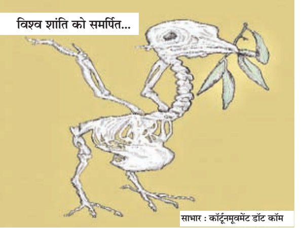
विश्व शांति को समर्पित...

(लेखक दिशा साई संस्थान हजारीबाग के संस्था प्रमुख हैं।)