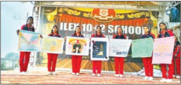
मानवाधिकार दिवस के मौके पर कार्यक्रम में शामिल बच्चे।