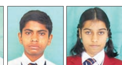
प्रतिभागियों को शुभकामनाएं तथा उनके उज्वल भविष्य की शुभकामनाएं दीं।

मेदिनीनगर। लोयेला स्कूल पटना में सीबीएसई रिजनल राउंड का आयोजन हो रहा है। जिसमें विद्यालय की टीम ने बिहार और झारखंड के 30 स्कूलों में से सेमीफाइनल के लिए मात्र के छह विद्यार्थियों का चयन हुआ। इसमें ऑक्सफोर्ड पब्लिक स्कूल मेदिनीनगर, सुरेन्द्रनाथ सेंटनरी विद्यालय रांची, सैनिक स्कूल गोपालगंज बिहार, डीएवी स्कूल हजारीबाग, डीपीएस रांची, एसडीएमएस जमशेदपुर, सीबीएसई हैरिटेज इंडिया क्यूज