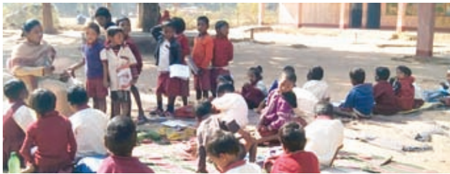
स्कूल परिसर में बैठकर बच्चों को पढ़ाती शिक्षिका।

गुमला। बच्चों के भविष्य की चिंता ने अभिभावकों को सरकारी स्कूल में प्राइवेट टीचर रखने को मजबूर कर दिया। अभिभावक दो प्राइवेट शिक्षकों को रखकर सरकारी विद्यालय में अपने बच्चों को शिक्षा दिला रहे हैं। क्योंकि उनके पास सरकारी स्कूल के अलावे कोई विकल्प नहीं है। मामला गुमला सदर प्रखंड के राजकीयकृत उत्कर्मित मध्य विद्यालय कुटवां की है। इस गांव में कभी पीएलएफआई उपाधवीत संगठन की तुती बोलती थी। गांव में उग्रवादी संगठन के द्वारा तीन लोगों की पूर्व में हत्या कर दी गई थी। अब उखावद के बादल छूट गये हैं लेकिन बच्चों को शिक्षारूपी प्रखंड प्रदान करने के लिए अब भी गांव के लोग जदोजहद कर रहे हैं। क्योंकि गांव के स्कूल में बच्चों को गुणवत्ता युक्त शिक्षा नहीं मिल रही है। कुटवां स्कूल में केजी से लेकर आठ वर्ग तक की कक्षाएं संचालित है