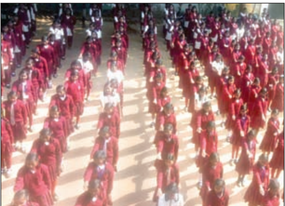
जागरूकता कार्यक्रम में उपस्थित बच्चे।