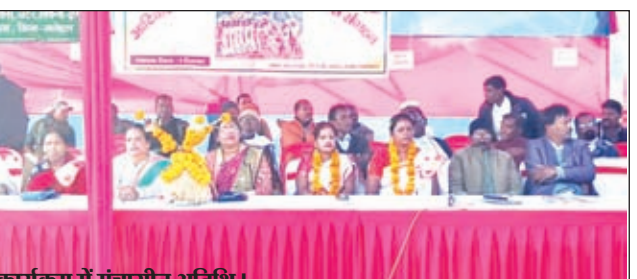
कार्यक्रम में मंचासीन अतिथि।