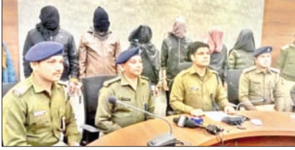
जानकारी देते एसपी, पकड़े गये अपराधी।