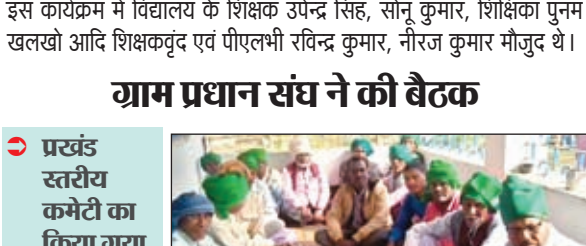
शिविर में उपस्थित पदाधिकारी।

लातेहार। झारखंड विधिक सेवा प्राधिकार रांची झालसा के तत्वाधान में प्रथम जिला एवं सत्र न्यायाधीश लातेहार