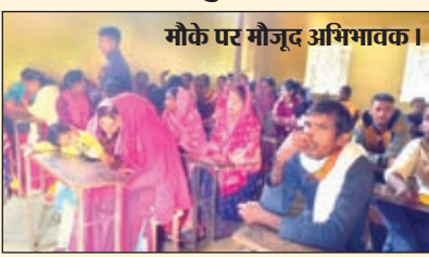
मौके पर मौजूद अभिभावक।