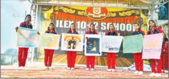
मानवाधिकार दिवस के मौके पर कार्यक्रम में शामिल बच्चे।