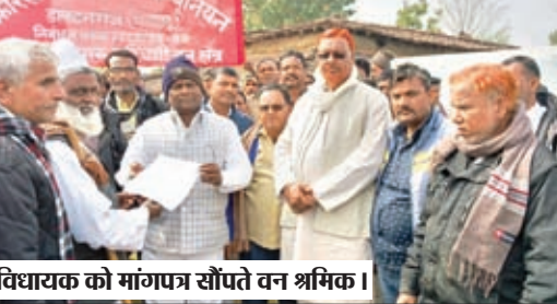
विधायक को मांगपत्र सौंपते वन श्रमिक।