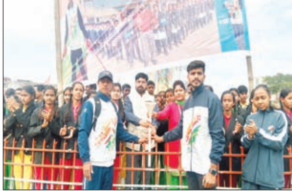
गतका खेल में शामिल बच्चे।

11 व 12 दिसंबर को खेल प्रतियोगिता का होगा आयोजन