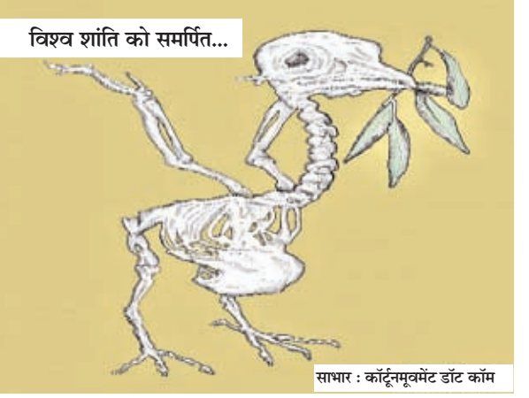
साधार : कर्दूरमूर्धमेट डॉट कॉम

है। इतना ही नहीं, बल्कि अपनी मां के सामने इसकी स्वीकारोक्ति में भी उन्हें झिझक नहीं होता। यद्यपि यह प्रेम भावना लगभग 70-75 प्रतिशत आंखों के इशारों की भाषा में ही होती है। कहानी के तीन चौथाई हिस्से के बाद ही उनका पहला संवाद होता है। उधर मैक का उन बहनों के प्रति प्रेम और झुकाव एक सामान्य पाठक को इस ओर सोचने को प्रेरित करता है कि उस वक्त के किसी अंग्रेज अफसर की ऐसी ही कहानी हो सकती है, जिसमें उसका भावनात्मक जुड़ाव किसी गांव की एक साधारण हिंदुस्तानी लड़की से भी हो सकता है और वो उसके प्रेमपाश में भी बंध सकता है। क्योंकि एक आम पाठक ने तो अपने अकादमिक या अन्य पुस्तकों में गुलामी काल में बस अंग्रेजों के साथ हिंदुस्तानियों के संघर्ष अथवा गुलामी के ही प्रसंग को पढ़ा सुना है। पंसारन के संघर्ष में लेखक ने तत्कालीन समाज में एक विधवा स्त्री की संघर्ष गाथा को भी खूब उकेरा है।