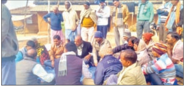
बैठक करते जनप्रतिनिधि व ग्रामीण।