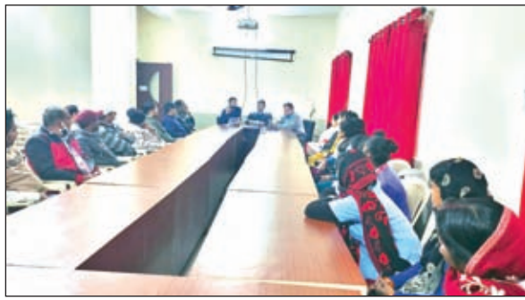
कार्यशाला में शामिल लोग।

प्रावधान किया गया है जिसमें 5 साल की कैद अथवा 5 लाख का आर्थिक दंड या दोनों हो सकता है। दोनो प्रशिक्षक दिल्ली स्थित डॉ श्रीफ चैरिटी आंख अस्पताल में आयोजित एवम क्रिस्चियन ब्लाईड मिशन (सीबीएम) द्वारा प्रायोजित तीन दिवसीय (1 दिसंबर से 3 दिसंबर) प्रशिक्षण लेकर लौटे है। इस कार्यक्रम में हॉस्पिटल स्टॉफ मिंटू