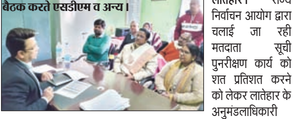
बैठक करते एसडीएम व अन्य।

लातेहार। राज्य निर्वाचन आयोग द्वारा चलाई जा रही मतदाता सूची पुनरीक्षण कार्य को शत प्रतिशत करने को लेकर लातेहार के अनुमंडलाधिकारी