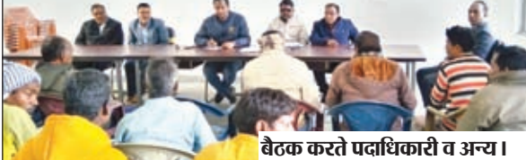
बैठक करते पदाधिकारी व अन्य।

लातेहार। अनुमंडल पदाधिकारी महुआडांड के द्वारा बताया गया कि इस वर्ष धान अधिप्राप्ति 15 दिसंबर से प्रारम्भ होगा। इस संबंध में ज्यादा से ज्यादा किसानों को धान अधिप्राप्ति हेतु निबंधन कराने के लिए जागरूक करें। इस बार साधारण धान के न्यूनतम समर्थन मूल्य 2040 प्रति क्विंटल एवं ग्रेड ए धान ले लिए 2060 प्रति क्विंटल न्यूनतम समर्थन मूल्य सरकार द्वारा तय किया गया है। साथ ही प्रति क्विंटल 10 रुपए अतिरिक्त प्रदान किया जाएगा उन्होंने कहा किसानों को धान के न्यूनतम समर्थन मूल्य