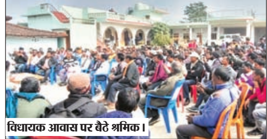
विधायक आवास पर बैठे श्रमिक।

लंबित मजदूरी भुगतान कराने को लेकर गंभीर नहीं है वन विभाग के अधिकारी : श्रमिक