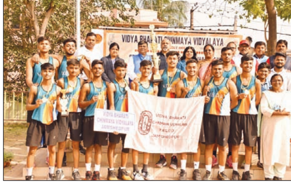
चैंपियनशिप जीतने वाली चिन्मय स्कूल टेल्लको की बालक टीम, बालिका संवर्ग की चैंपियन टीम केपीएस बर्मागांस।