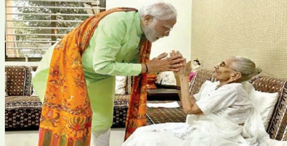
और गांधीनगर से भाजपा सांसद अमित शाह अहमदाबाद के नारणपुरा में नगर निगम के एक कार्यालय में स्थापित केंद्र में मतदान करेंगे। मोदी रानिप क्षेत्र के पंजीकृत मतदाता हैं और उन्होंने

विधानसभा के दूसरे चरण के चुनाव से पहले रविवार को प्रधानमंत्री नरेंद्र मोदी अहमदाबाद पहुंचे। पीएम गांधीनगर में मां हीराबेन मोदी से मिलने के लिए उनके आवास पर पहुंचे और चरण स्पर्श कर उनका आशीर्वाद लिया। मोदी ने मां के यहां करीब 45 मिनट बिताया। जिसके बाद वह वहां से निकल गए। मोदी रात्रि विश्राम राजभवन में करेंगे। प्रधानमंत्री सोमवार सुबह अहमदाबाद शहर के रानिप इलाके में एक विद्यालय में स्थापित मतदान केंद्र में अपने मताधिकार का इस्तेमाल करेंगे। केंद्रीय गृह मंत्री