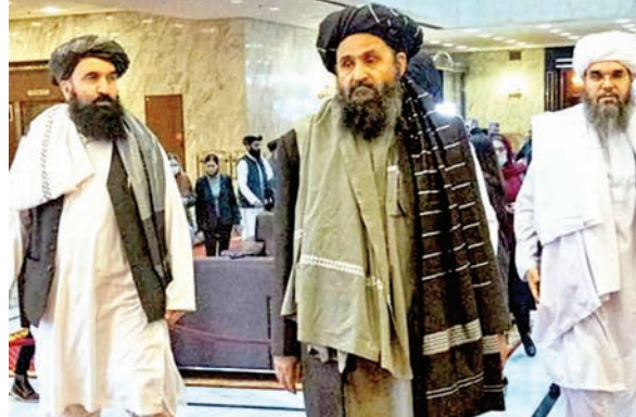
तालिबान को वैश्विक स्तर पर मिले मान्यता : विदेश मंत्रालय का यह भी मानना है कि, तालिबान

पाकिस्तान के साथ तालिबान के रिश्ते लगातार तनावपूर्ण हो रहे हैं जबकि पिछले दिनों वहां के दूतावास में कार्यरत कूटनीतिक तकनीकी टीम से तालिबान ने आग्रह किया गया है कि भारत वहां अपनी लंबित परियोजनाओं को शुरू करें। हालांकि भारत वहां के हालात