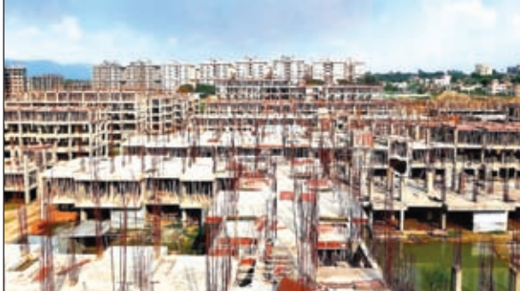
बिरसानगर में निर्माणाधीन मकान।

चरण में 3836 लाभुकों तथा दूसरे चरण में कुल 834 लाभुकों का आवास आवंटन उपायुक्त, पूर्वी सिंहभूम, जमशेदपुर की अध्यक्षता में किया जा चुका है। वर्तमान में यदि कोई आवेदक अब तक आवास हेतु आवेदन जमा नहीं कर सके है ऐसे लोगों के लिए एक बार फिर से आवेदन करने की अनुमति प्रदान की गई है, इच्छुक आवेदक अगले आदेश तक जमशेदपुर अधिसूचित क्षेत्र समिति में अपना आवेदन जमा कर सकते हैं।