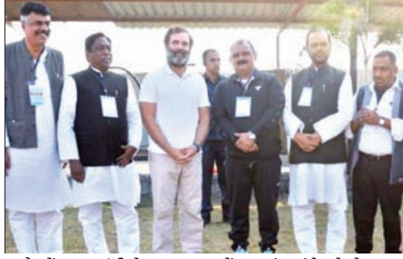
इन्दौर में राहुल गांधी से मुलाकात करते झारखंड कांग्रेस के नेता