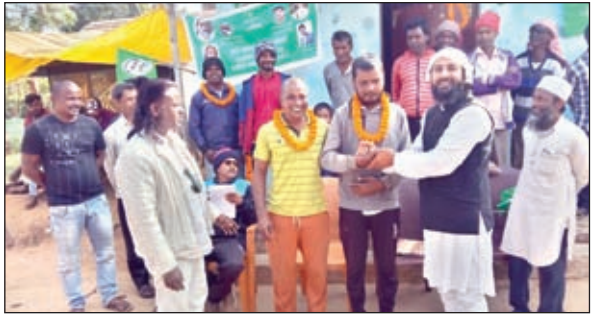
पदाधारियों का स्वागत करते मोर्चा नेता।