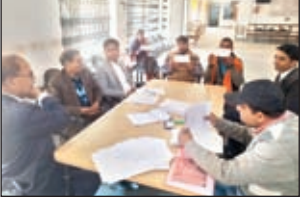
लातेहार एवं गढ़वा जिला के ग्रामीणों द्वारा वेलफेयर बिडिंग एंड स्टेट प्रा. लिमिटेड विशाखापट्टनम में पैसा दुगना करने के लिए 2010 में जमा करवाया गया था।