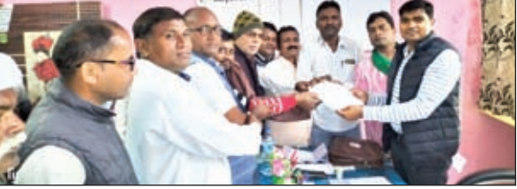
मांग पत्र सौंपते ग्रामीण।