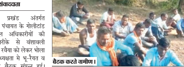
बैठक करते ग्रामीण।