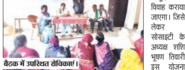
बैठक में उपस्थित सेविकाएं।

झारखंड की स्वयंसेवी संस्था नीलांबर-पीतांबर विकास सोसाइटी के द्वारा