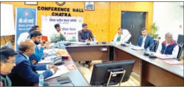
बैठक की समीक्षा करते डीसी व अन्य पदाधिकारी।

बैठक में मुख्य रूप से वार्षिक ऋण योजना 2022-2023 बैकौ की उपलब्धियों पर चर्चा, वित्तीय वर्ष 2022-2023 के लिए सी.डी. रेशियों पर चर्चा, सरकार प्रायोजित विभिन्न योजनाएं तथा किसान क्रेडिट कार्ड, प्रधान मंत्री रोजगार सृजन कार्यक्रम, एसएचजी योजना, एआईएफ हेतु लक्ष्य एवं