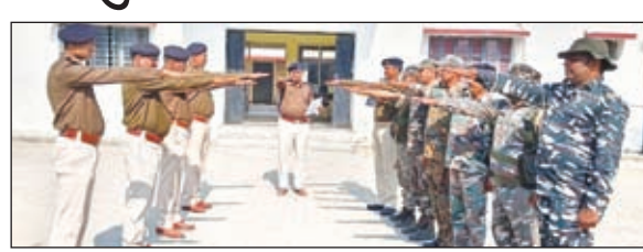
संविधान प्रस्तावना की शपथ लेते पुलिसकर्मों

बरही। बरही थाना परिसर में संविधान दिवस के अवसर पर पुलिस पदाधिकारियों ने भारत की प्रस्तावना पढ़कर शपथ लिया। इस मौके पर सभी पदाधिकारियों ने संविधान की प्रस्तावना को दोहराया।