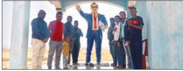
मौके पर उपस्थित लोग