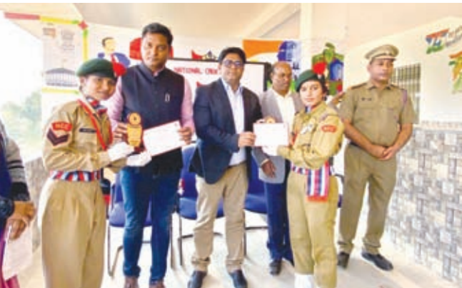
एनसीसी कैडेटों को प्रमाण पत्र देते डीएसई व डीएसओ