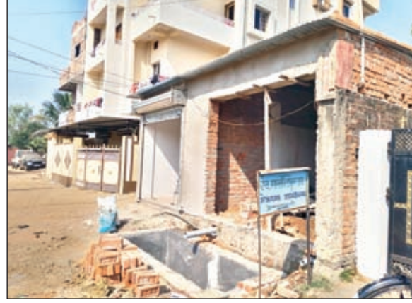
तालाब में की गयी बाउंड्री, अतिक्रमणित भूमि पर दुकान का निर्माण, लगाया गया सूचना पट्ट