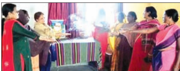
शपथ दिलाते मुखिया