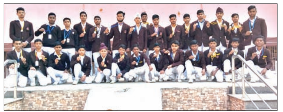
कार्यक्रम में शामिल

रामगढ़। श्री गुरु नानक पब्लिक स्कूल में 26 नवंबर को संविधान दिवस मनाया गया। इस दिवस को मनाने का मुख्य उद्देश्य छात्रों को भारतीय संविधान के बारे में जानकारी देना था। संविधान दिवस हर साल 26 नवंबर को मनाया जाता है। छात्र-छात्राओं ने संविधान के महत्व को प्रदर्शित करते हुए विभिन्न कार्यक्रमों की प्रस्तुति दी। बच्चों ने प्रार्थना सभा में विद्यालय के प्रांगण में अनेक प्रस्तुति दे माहौल को बहुत ही आकर्षक बना दिया। विद्यालय की एक बालिका ने संविधान के महत्व को दर्शाते हुए महत्वपूर्ण बिंदुओं को बताया। बच्चों ने श्लोक बोला, पोस्टर तैयार किया। प्रधानाध्यापक ने बच्चों को सर्टिफिकेट तथा मेडल प्रदान कर सम्मानित किया। संविधान के