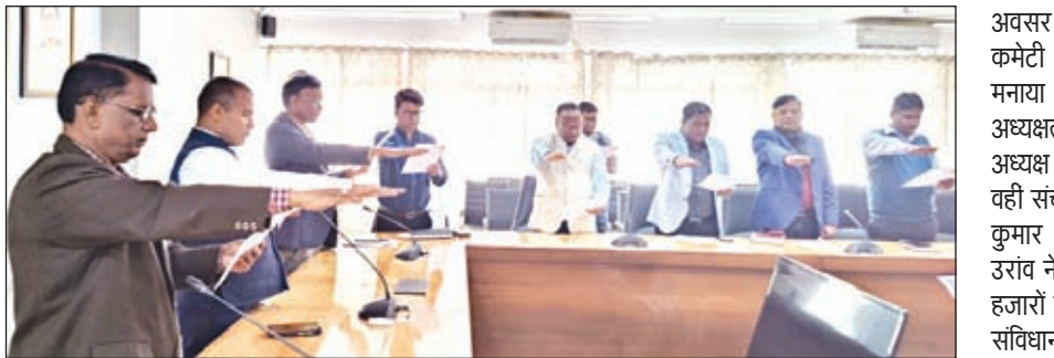
अवर मन्त्र संवाददाता