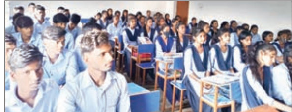
जानकारी प्राप्त करते छात्र।