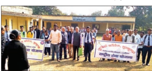
संविधान दिवस पर उपस्थित छात्र छात्राएं