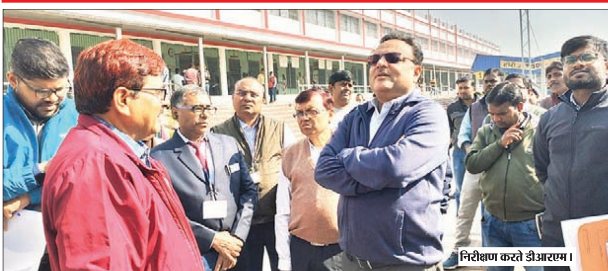
निरीक्षण करते डीआरएम ।

टोरी एसएस ने पश्चिमी छोर पर फुटओवर ब्रिज निर्माण व टीआई ने रटवी प्रकाश व्यवस्था की रटवी समस्या अधिकारियों ने कहा ब्रिज सँवधान हो गया है, 1 वर्ष के अंदर पश्चिमी छोर पर फुटओवर ब्रिज का विस्तार हो जाएगा