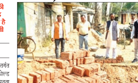
कोल्ड स्टोर निर्माण कार्य की निरीक्षण करते जनप्रतिनिधि ।