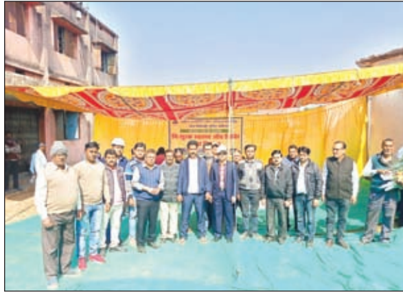
शिविर में मौजूद मुख्य अतिथि व अन्य अधिकारी