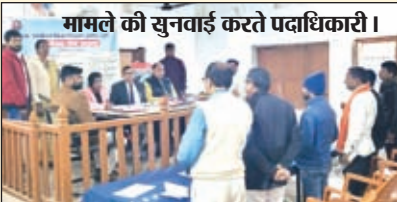
मामले की सुनवाई करते पदाधिकारी ।