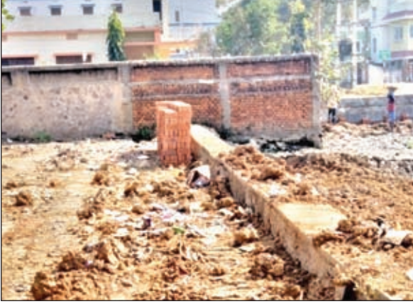
तालाब में की गयी बाउंड्री, अतिक्रमणित भूमि पर दुकान का निर्माण, लगाया गया सूचना पट्ट

तालाब में ही मार दी है बाउंड्री, कार्य में डाल रहे बाधा, अतिक्रमणित जमीन पर मकान के बाद बना दी दुकान