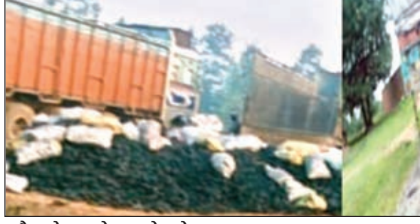
अवैध कोयला लोड कर ले जाते ट्रक

चरही। क्षेत्र के चनारो, इंद्रा चुरचू और आंगो थाना क्षेत्र में अवैध कोयले की तस्करी अवाध गति से जारी है। सूत्र बताते हैं कि इस तस्करी में पुलिस, कोयला तस्कर और उपवादिियों संगठन के गठजोड़ के कारण तीव्र गति से चल रहा है। इस काले हारे के धंधे में लोग माला-माल हो रहे हैं। दोनों थाना क्षेत्र से प्रतिदिन 10 से 15 ट्रक कोयले की तस्करी तस्करों द्वारा किया जा रहा है। सूत्र बताते हैं कि उपर के कई सफेद और खाखी पोश