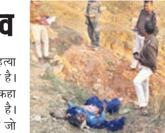
शव को देखते एसडीपीओ।

लोहरदगा। 19 साल की एक लड़की का तेजाब से जला हुआ शव बरामद हुआ है। सदर थाना क्षेत्र के बक्सो खखसीगड़ा में लड़की को शव मिलने से क्षेत्र में सनसनी फैल गई है। समाचार लिखे जाने तक शव की पहचान नहीं हो सकी है। इधर इस