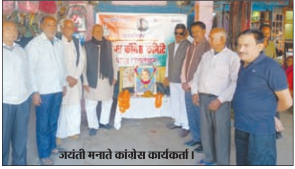
जयंती मनाते कांग्रेस कार्यकर्ता।