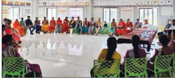
मौके पर उपस्थित ग्रामीण

बड़कागांव। गोंदलपुरा खन्नन परियोजना के तहत अदाणी फॉउंडेशन ने बड़कागांव की महिलाओं को एक अनोखा अवसर प्रदान किया। फॉउंडेशन के सहयोग से यहां की 25 महिलाओं ने छत्तीसगढ़ स्थित विभिन्न खन्नन परियोजनाओं का दौरा किया और वहां कॉर्पोरेट सोशल रिस्पॉसिबिलिटी (सीएसआर) के तहत चल रहे विभिन्न कार्यों को नजदीक से देखा। इन कार्यों को देख महिलाओं का समूह बेहद प्रभावित हुआ और इस गोंदलपुरा और आसपास के गांव में भी शुरू करने की इच्छा जाहिर की। अपने तीन दिवसीय इस दौर में महिलाओं ने छत्तीसगढ़ के परसा और सालही में अदाणी फॉउंडेशन द्वारा चलाई जा रही परियोजना रूडनयनर का दौरा किया। इस दौरान महिलाओं ने यहां चल रही गतिविधियों जैसे - मसाला पीसने और पैकेजिंग, डेयरी, जैविक खाद उत्पादन इकाई,