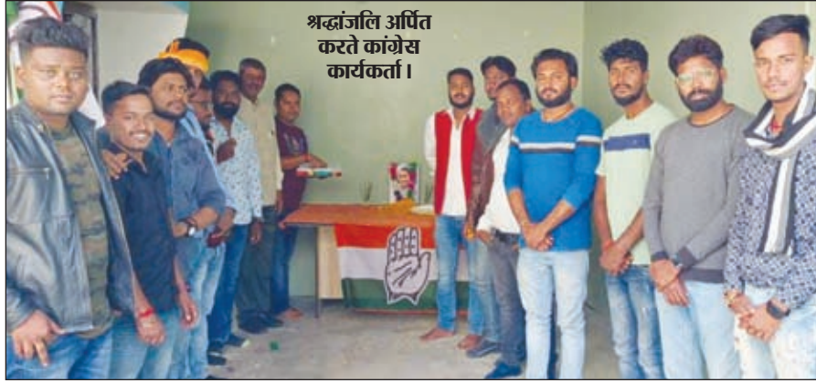
श्रद्धांजलि अर्पित करते कांग्रेस कार्यकर्ता।