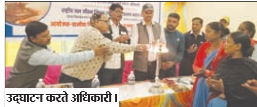
उद्घाटन करते अधिकारी।