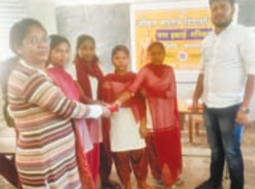
कार्यक्रम में उपस्थित शिक्षक व विद्यार्थी।

जीवन काल में ही ऐसा आदर्श स्थापित करके विदा हुईं, जिससे हर कोई प्रेरणा ले सकता है। कहा जाता है कि सच्चे वीर को कोई भी प्रलोभन अपने कर्तव्य से विमुख नहीं कर सकता, ऐसा ही रानी लक्ष्मीबाई का जीवन था। उनके मन में अपने राज्य और राष्ट्र से एकात्म स्थापित करने वाली भक्ति हमेशा विद्यमान रही। मौके पर विद्यालय के शिक्षकों के साथ कई विद्यार्थी उपस्थित थे।