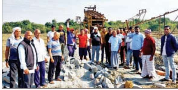
पत्थर माफिया का विरोध करते ग्रामीण

इचाक। थाना क्षेत्र के भुसाई, साडम और टेपसा गांव के सिमाना पर पत्थर माफिया द्वारा मनमानी तरीके से क्रशर मशीन लगाने का दर्जनों ग्रामीणों ने जम कर विरोध किया। ग्रामीण दर्जनों की संख्या में क्रशर लगाए जाने के स्थान पर पहुंच नारेबाजी भी की और किसी कीमत पर नहीं लगाने देने की बात कही। ग्रामीणों ने एक स्वर में कहा की पत्थर माफिया पहले ही इस क्षेत्र को बर्बाद कर चुके हैं, मगर