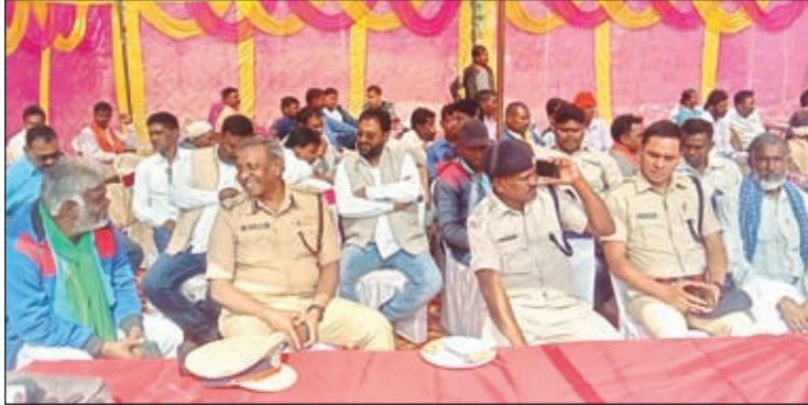
उद्घाटन समारोह में उपस्थित प्रशासनिक पदाधिकारी व अन्य