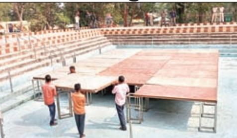
छट घाट के अंदर बना मंच और छट घाट से मंच हटवाता प्रशासन।

दिया। इसी मंच पर बाल मेला का उद्घाटन समारोह आयोजित था जिसमें शनिवार को अपराह्न तीन बजे राज्यसभा के अध्यक्ष एवं नामी पत्रकार हरिवंश भाग लेने वाले हैं। रघुवर समर्थकों का कहना था कि एक साजिश के तहत छट