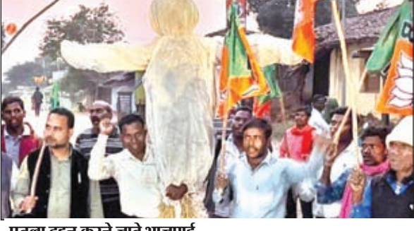
पुतला दहन करने जाते भाजपाई