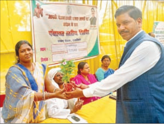
मौके पर उपस्थित लोग