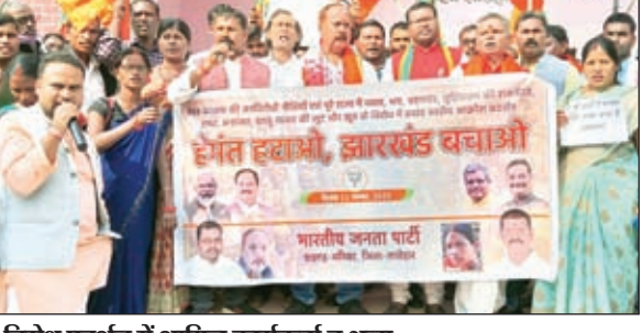
विरोध प्रदर्शन में शामिल कार्यकर्ता व अन्य

लूट और झूठ के विरोध में हेमंत सोरेन के खिलाफ प्रखंड स्तरीय जन आक्रोश रैली तथा धरना प्रदर्शन कार्यक्रम का आयोजन किया गया। जिसमें भाजपा के कार्यकर्ताओं के द्वारा उच्च विद्यालय मनिका के