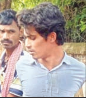
चंदवा पुलिस द्वारा पकड़ा गया अपराधी

थाना क्षेत्र अंतर्गत हड़गड़वा एवं कुसुमटोला के पास हुई गिरफ्तारी तीसरे की गिरफ्तारी को लेकर अभियान तेज