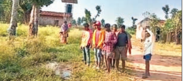
पानी जमा होने से बाधित चकला टोले की सड़क

जलमीनारों के समक्ष सोखता और नाली का निर्माण कराने की मांग