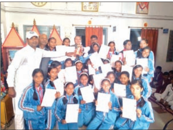
मौके पर उपस्थित लोग