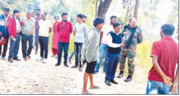
ग्रामीणों से वार्ता करते सीओ