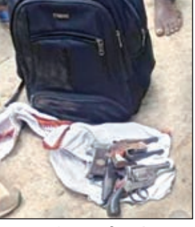
बराबद हथियार व पैसा से भरा बैग