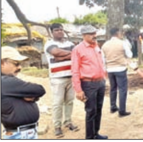
सहयक अभियंता को घटिया निर्माण की जानकारी देते ग्रामीण।