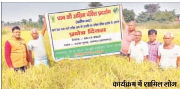
कार्यक्रम में शामिल लोग