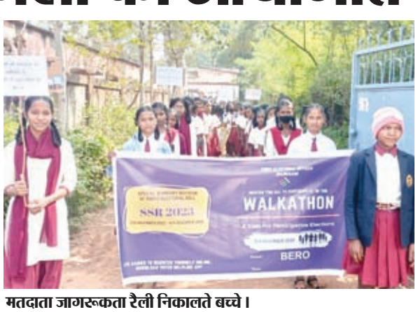
मतदाता जागरूकता रैली निकालते बच्चे।

हुए। रैली अंचल कार्यालय परिसर से प्रारम्भ होकर लोहरदगा रोड, महावीर चौक, बाजार टांड, देवी मंडप, बिजली ऑफिस, जामटोली रोड होते हुए पुनः अंचल कार्यालय