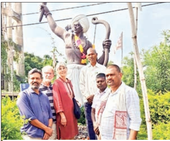
बिरसा मुंडा की प्रतिमा पर नमन करते विदेशी सैलानी