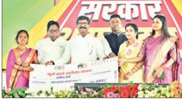
फूलों ज्ञानों के तहत महिला को चेक सौंपते मुख्यमंत्री, मंत्री एवं विधायक

आरक्षण देने जा रही है। राज्य के हर जनता की आय की बढ़ोतरी हो रही है। असहाय महिला को भी सरकार मान सम्मान की रक्षा कर रही है। जब तक गांव नहीं मजबूत होगा तब तक शहर नहीं मजबूत होगा। देश का पहला राज्य झारखण्ड है जो कर्मचारियों को पुरानी पेंशन की व्यवस्था किया गया। अंत में मुख्यमंत्री संधाली भाषा की मदद से मौजूद लोगों को धन्यवाद करते हुए