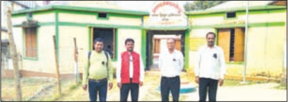
काला बिल्ला लगाकर कार्य करते शिक्षक