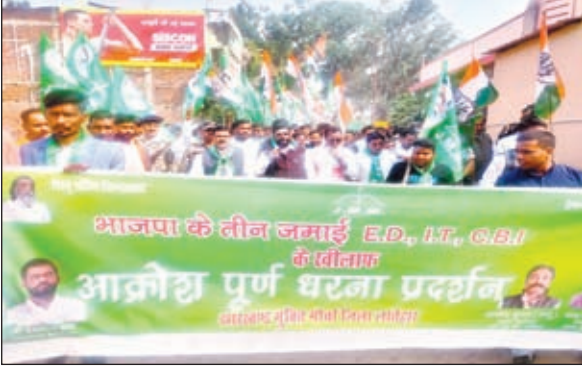
विरोध मार्च में शामिल विधायक व अन्य व रोषपूर्ण प्रदर्शन करते महागठबंधन के लोग

केन्द्र सरकार पर लगाया केन्द्रीय एजेंसियों का दुरुपयोग करने का आरोप