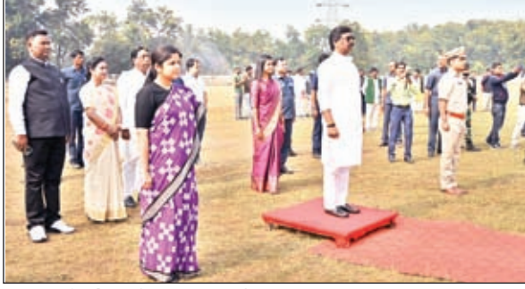
मुख्यमंत्री को गार्ड ऑफ ऑनर दिया गया।

रजरप्पा। आपकी योजना आपकी सरकार आपके द्वार कार्यक्रम के तहत छोटे से समय में राज्य की जनता का 31 लाख आवेदन आये जिस पर त्वरित कार्रवाई करते हुए 20 लाख आवेदनों का निष्पादन कर दिया गया। मुख्यमंत्री हेमंत सोरेन शनिवार को रजरप्पा स्टेडियम में आयोजित आपकी योजना में शामिल हुए। इस दौरान उन्होंने रामगढ़ जिले के लिए 255 योजनाओं का शिलान्यास किया। इस अवसर पर उन्होंने कहा कि ऐसे तो यह कार्यक्रम 14 नवंबर तक निर्धारित है। लेकिन इसके बाद भी यह कार्यक्रम चलती रहेगी। पूर्व की सरकार ने पारा शिक्षक, सैनिक, सहायिका को लाठी बरसाई थी। वर्तमान सरकार ने उन्हें हक देने का काम किया है। यह सरकार जनता के साथ खड़ी है। विपक्ष पैसों से लोकतंत्र को खरीदना चाहता है, लेकिन ऐसा नहीं हो सकता है। कोरोना के समय में भी सरकार ने राज्य में अफरा तफरी नहीं होने दिया। 31 लाख किसानों को विन्दिता कर सूखा ग्रस्त के तहत मुआवजा की राशि उपलब्ध कराएगी। जनता के लिए काम कर रहे हैं तो हमलोगों के पीछे इंडी और सीबीआई लगा दिया गया है। जिन राज्यों में भाजपा की सरकार नहीं है वहा सरकार गिराने की षडयंत्र चल रही है। सरकार ने जेपीएससी का रिजल्ट निकाला। बीपीएल परिवार के बच्चे बीडीओ, सीओ बन रहे हैं। यहां के आदिवासी मूलवासी आगे बढ़े। हमारी सरकार विदेश में पढ़ रहे बच्चे को राशि उपलब्ध करा रही है। गुरुजी कार्ड के तहत छात्रों को सुविधा दिया जायेगा। अलग राज्य की पहचान गुरुजी ने दिलाया। हेमंत सरकार 1932 एवं ओबीसी का