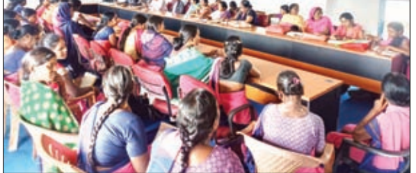
प्रशिक्षण देते बीडीओ