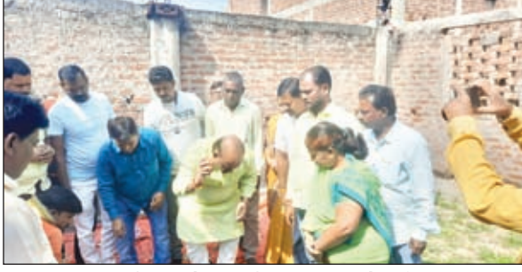
नारियल फोड़ कर शिलान्यास करते मंत्री