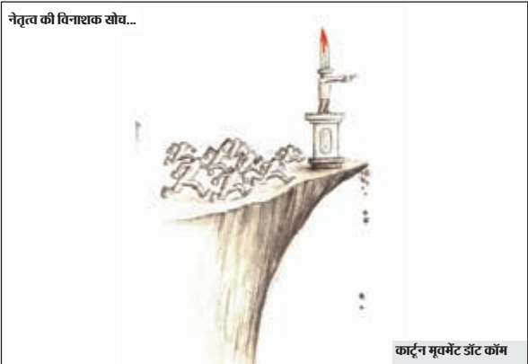
कार्टून मुव्गट डैट कॉम