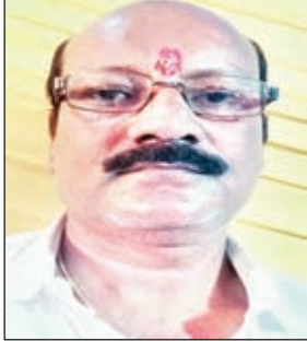
मुख्यमंत्री हेमंत सोरेन को रांची