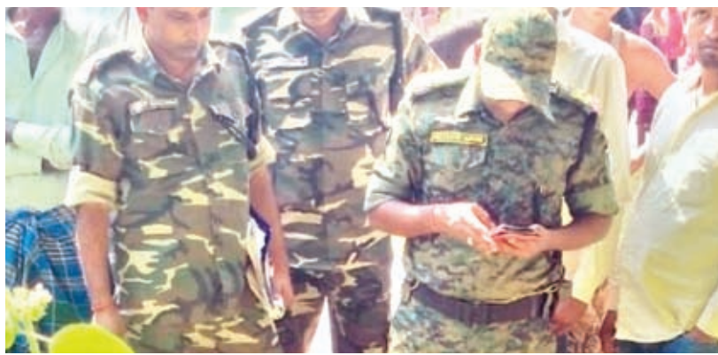
घटना की जांच करते मेराल थाना की पुलिस अधिकारी व अन्य।