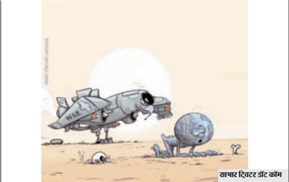
सागर शिवर उदर काम